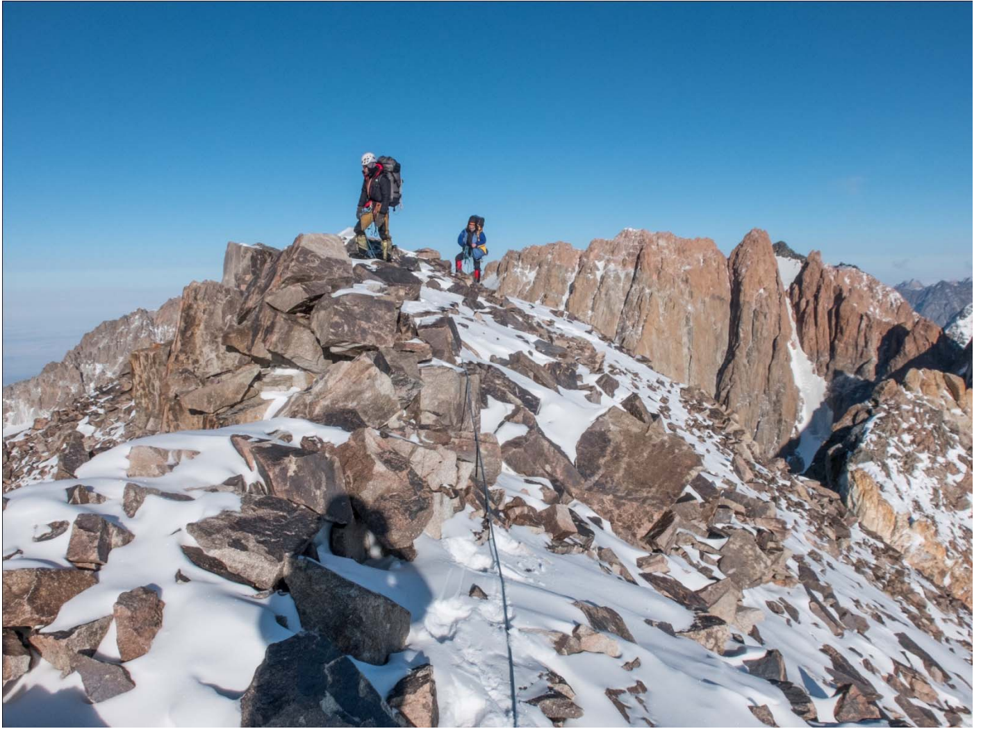
Рис 7: Идём по гребню до вершины, солнечно.