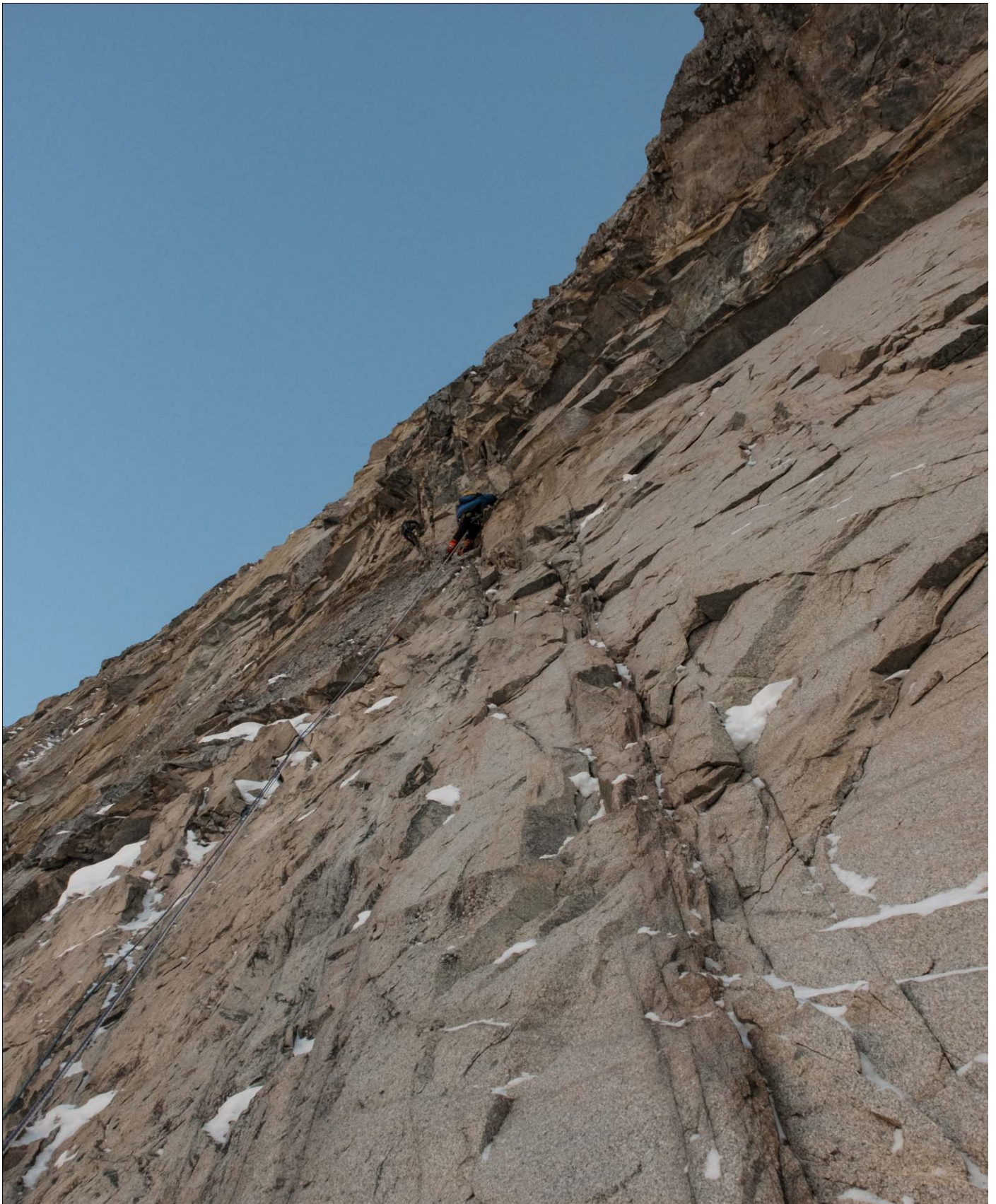
Рис 4: Обработка первой веревки от полки ночевки, первый день, участок 6-7.