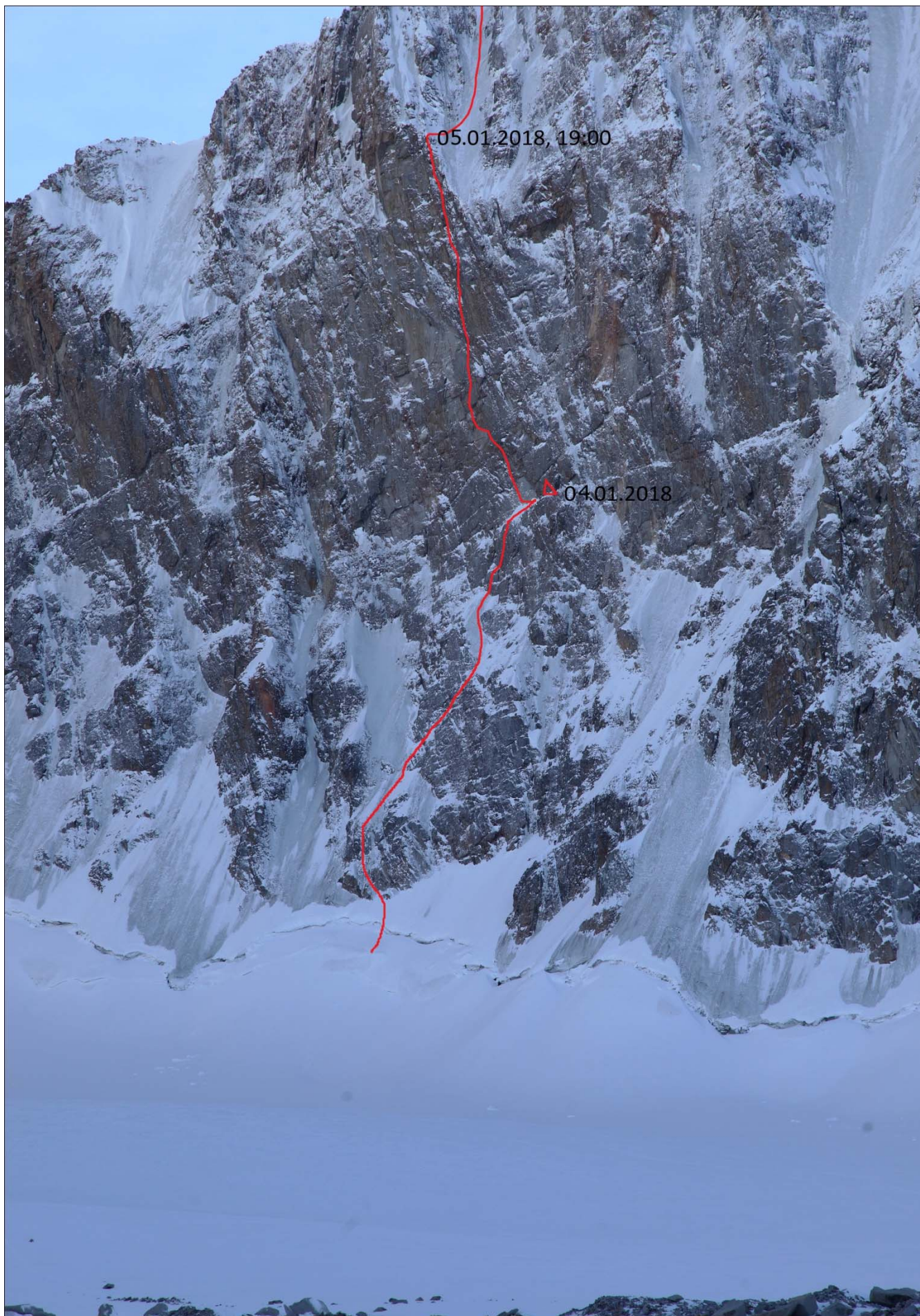
Рис.2: Фотография стенной части маршрута.