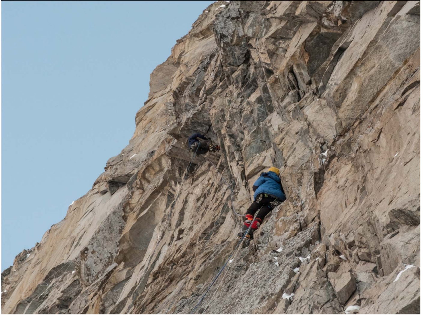
Рис 5: Прохождение большого карниза, участок 7-8.