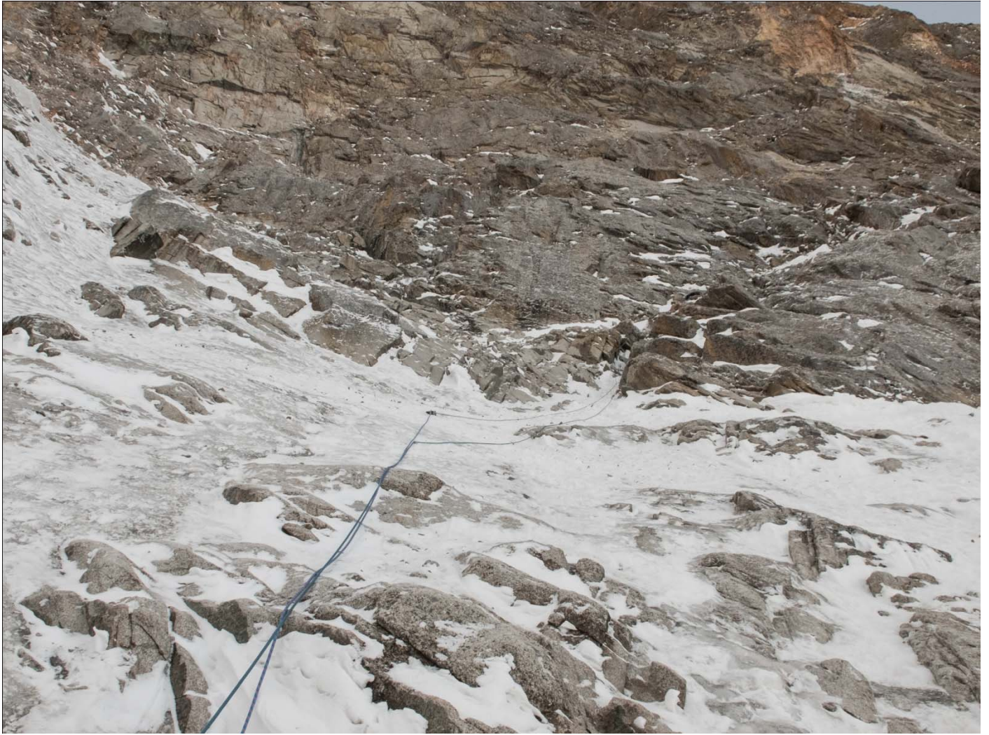
Рис 3:Конец участка 2-3, начало участка 3-4,лидер находится в микстовом внутреннем углу, движется вправо вверх.