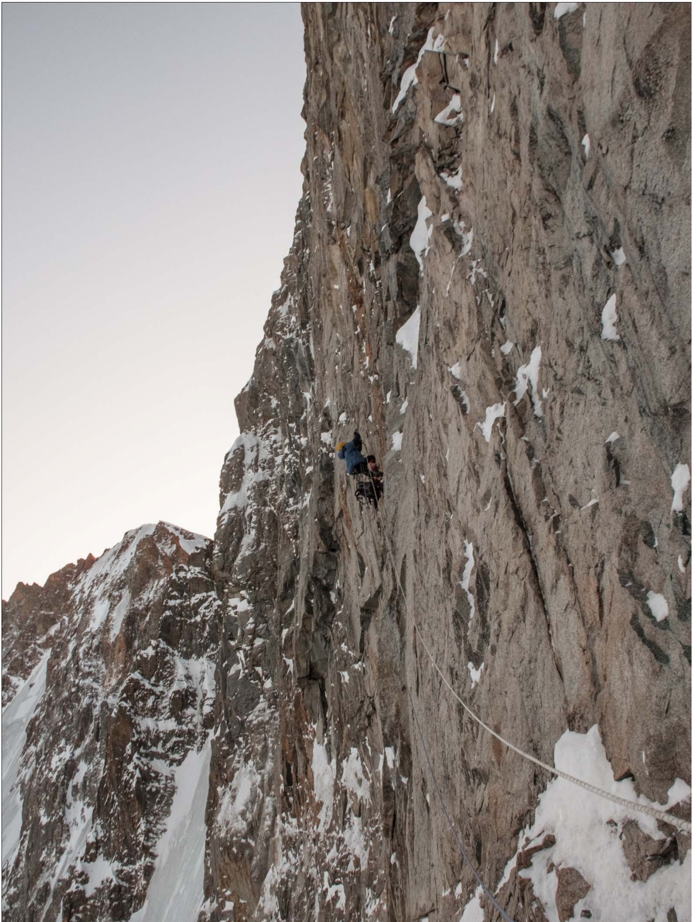
Рис 6:Второй день, уходим в отрыв по провешенным перилам. Вид с полки ночевки. Хорошо виден "уклон" участка.