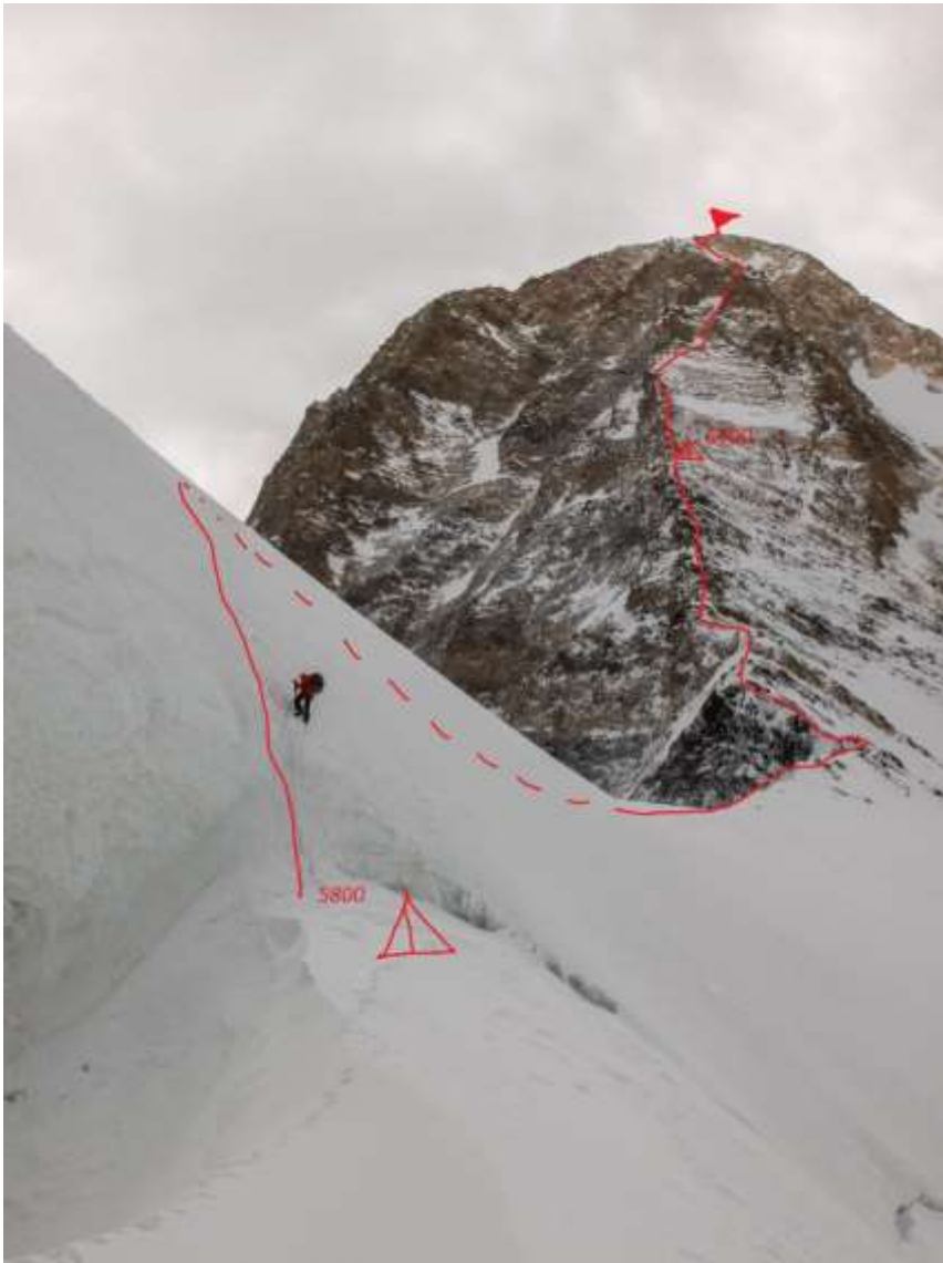
1.2 Маршрут, пройденный командой.