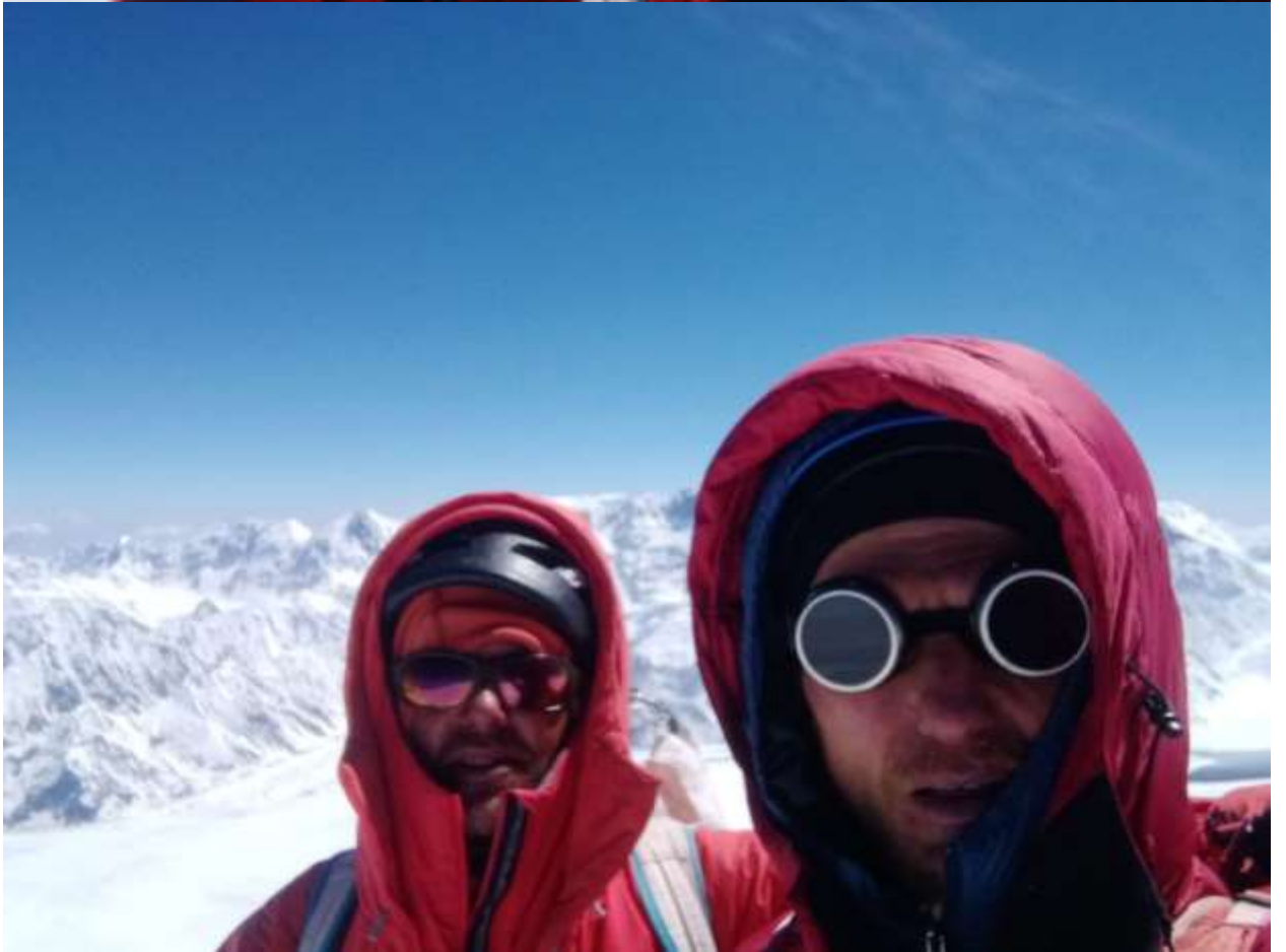
Фото 7, 8 Команда на вершине