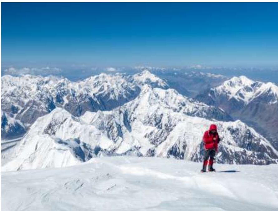
Фотоб Выход второго (Вячеслав Тимофеев) участника на вершину