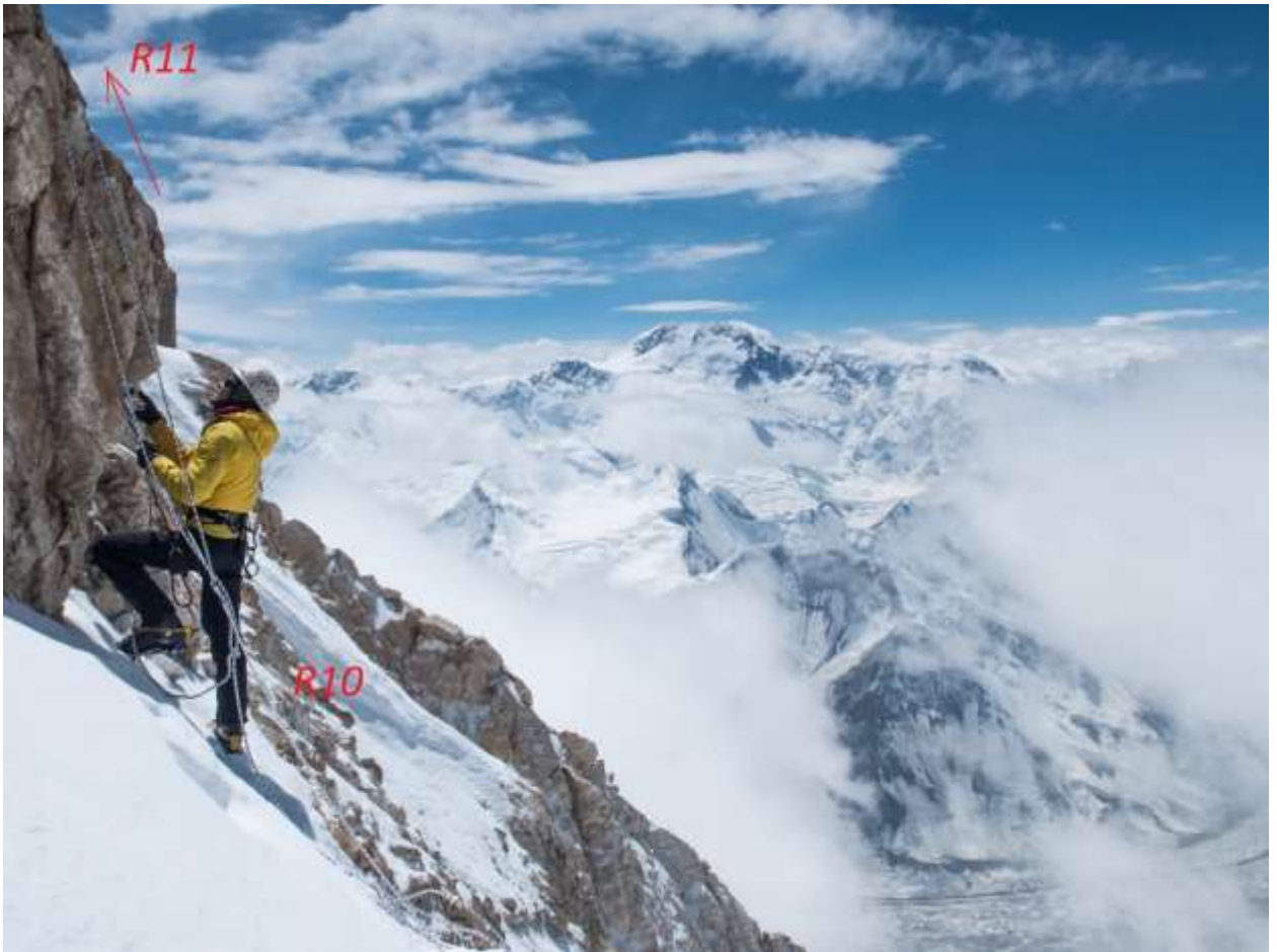
Фото5 Участок R10-R11.(фото 2017 года)