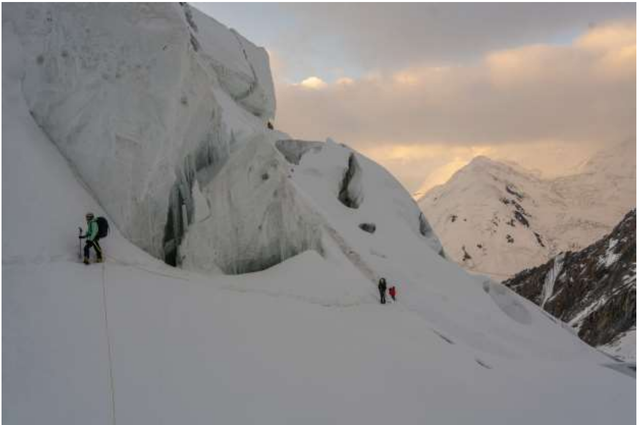
Фото2 Начало участка R1-R2(фото с акклиматизационного выхода)