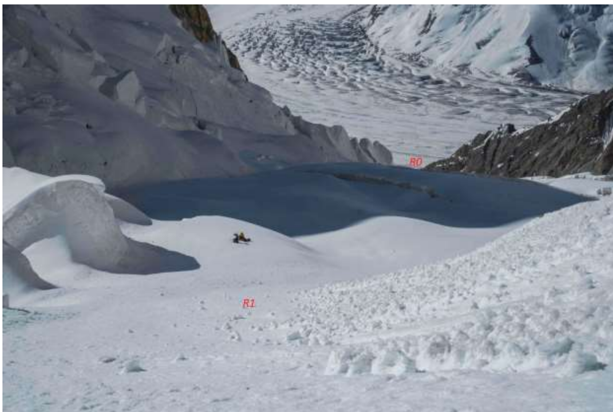
Фото1 Участок R0-R1(Фото 2017года)

15.08.2022. Собрав бивуак начали спуск в 3 часа утра, в 8.30 вернулись в базовый лагерь «Южный Иныльчек»