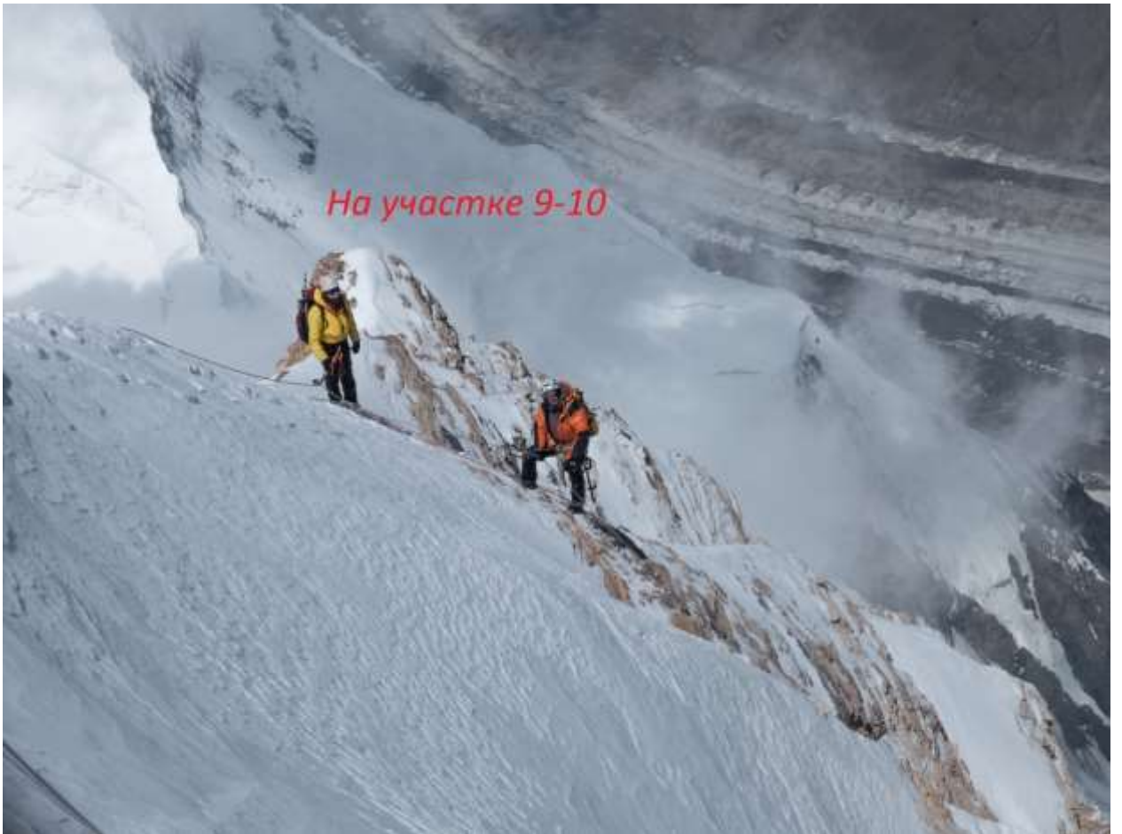
Фото4 Участок R9-R10(фото 2017 года)