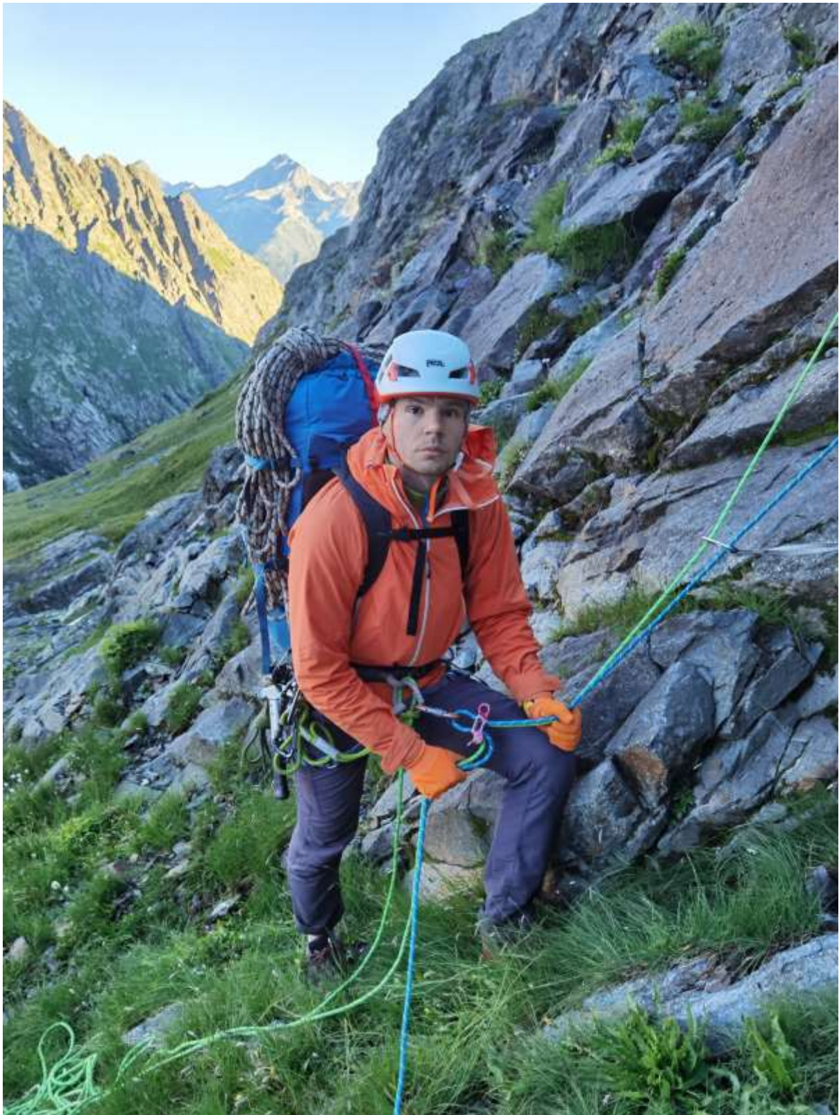
Фото 1. Начало маршрута