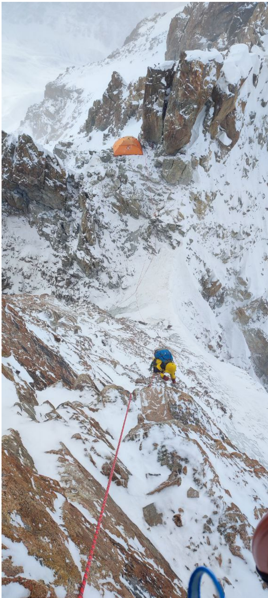
Фото 7. Участок R 4 -R 5 . Место ночевки на гребне.