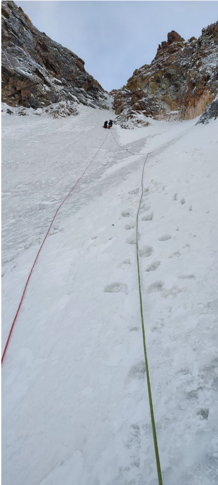
Фото 5. Участок R 2 -R 3