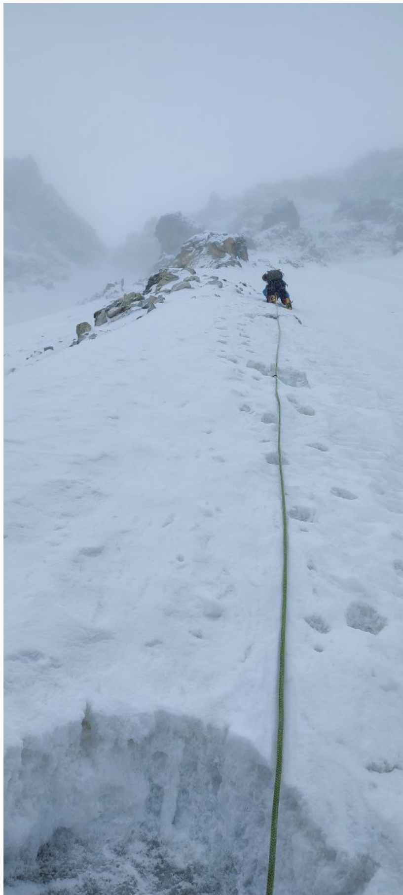
Фото 3. Гребень на R1