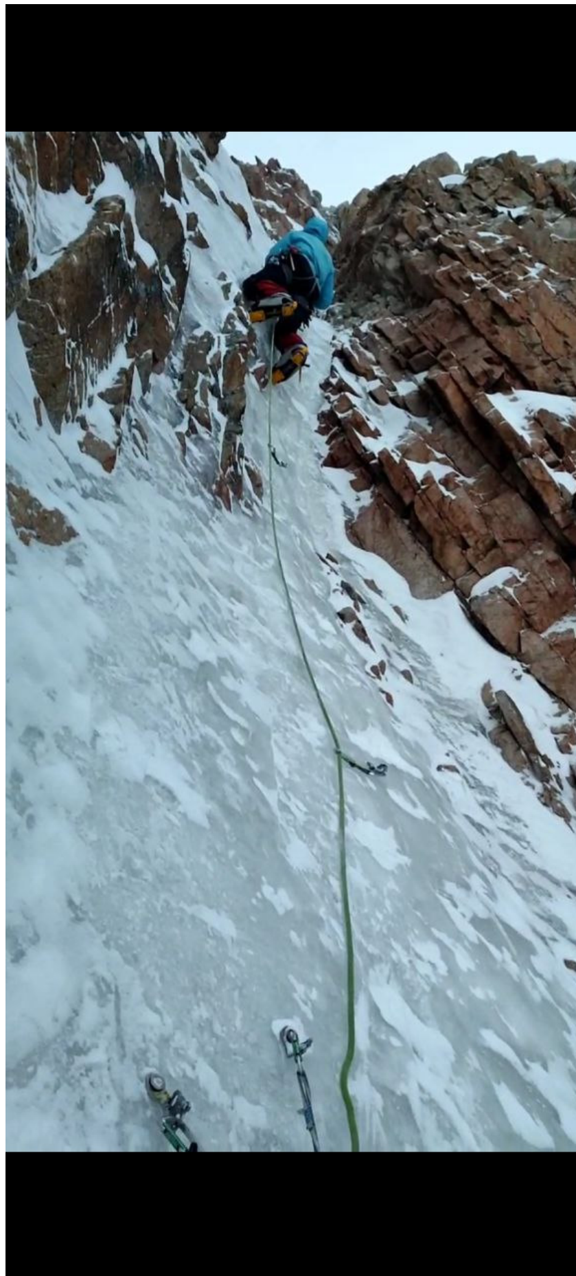
Фото 6. Участок R 3 -R 4