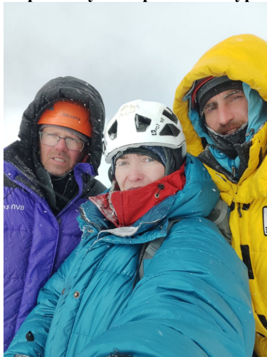
Фото на вершине. (4й участник в кадр не попал)