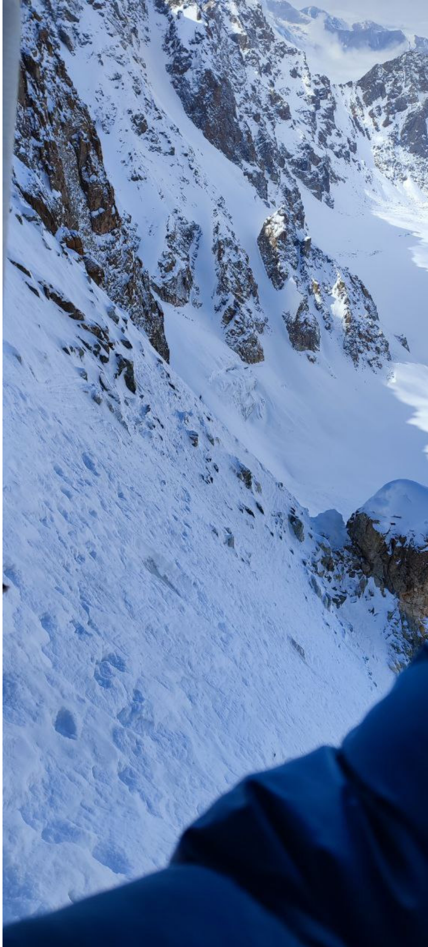
Фото 4. Участок R 1 -R 2