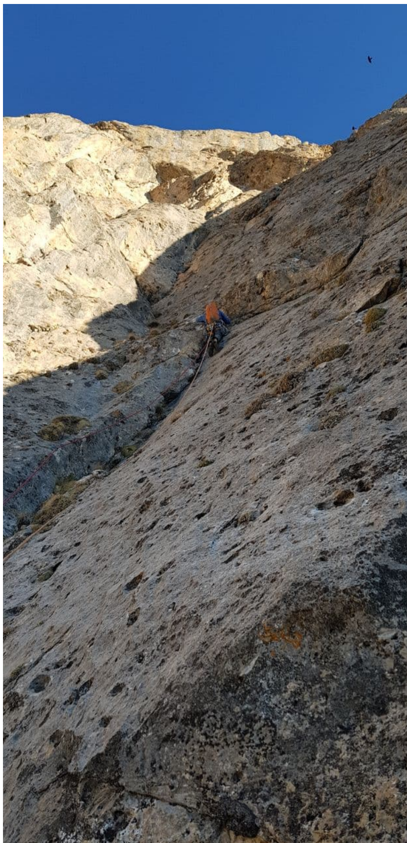
Рис. 20: Работа на R17-R18