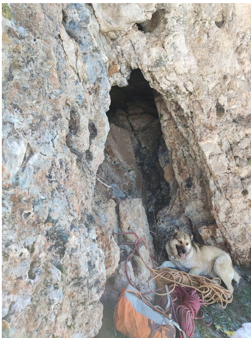
Рис. 7: Начало маршрута слева от грота