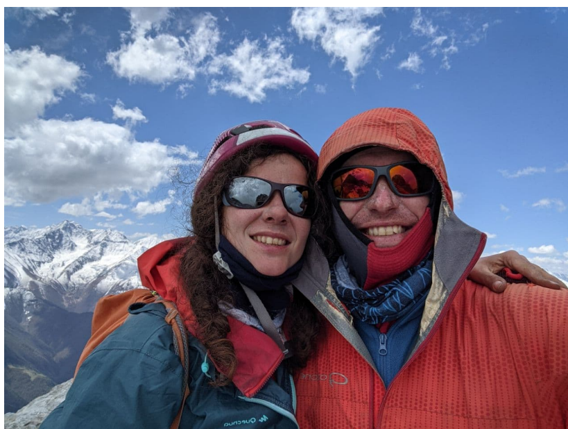
Рис. 22: Вершина