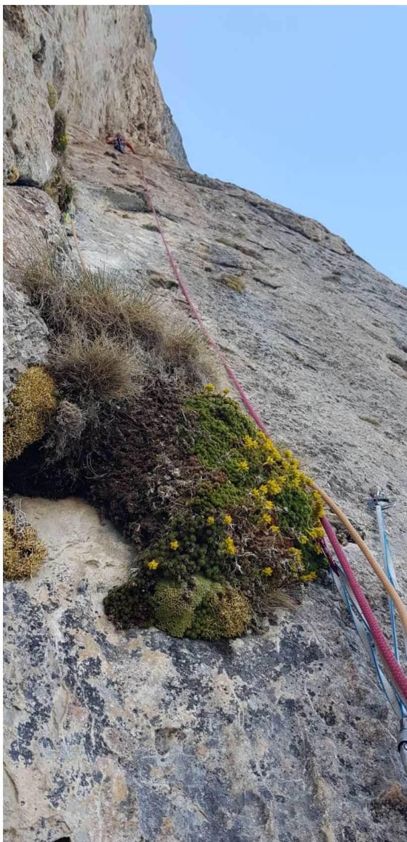
Рис. 17: Работа лидера на R15-R16