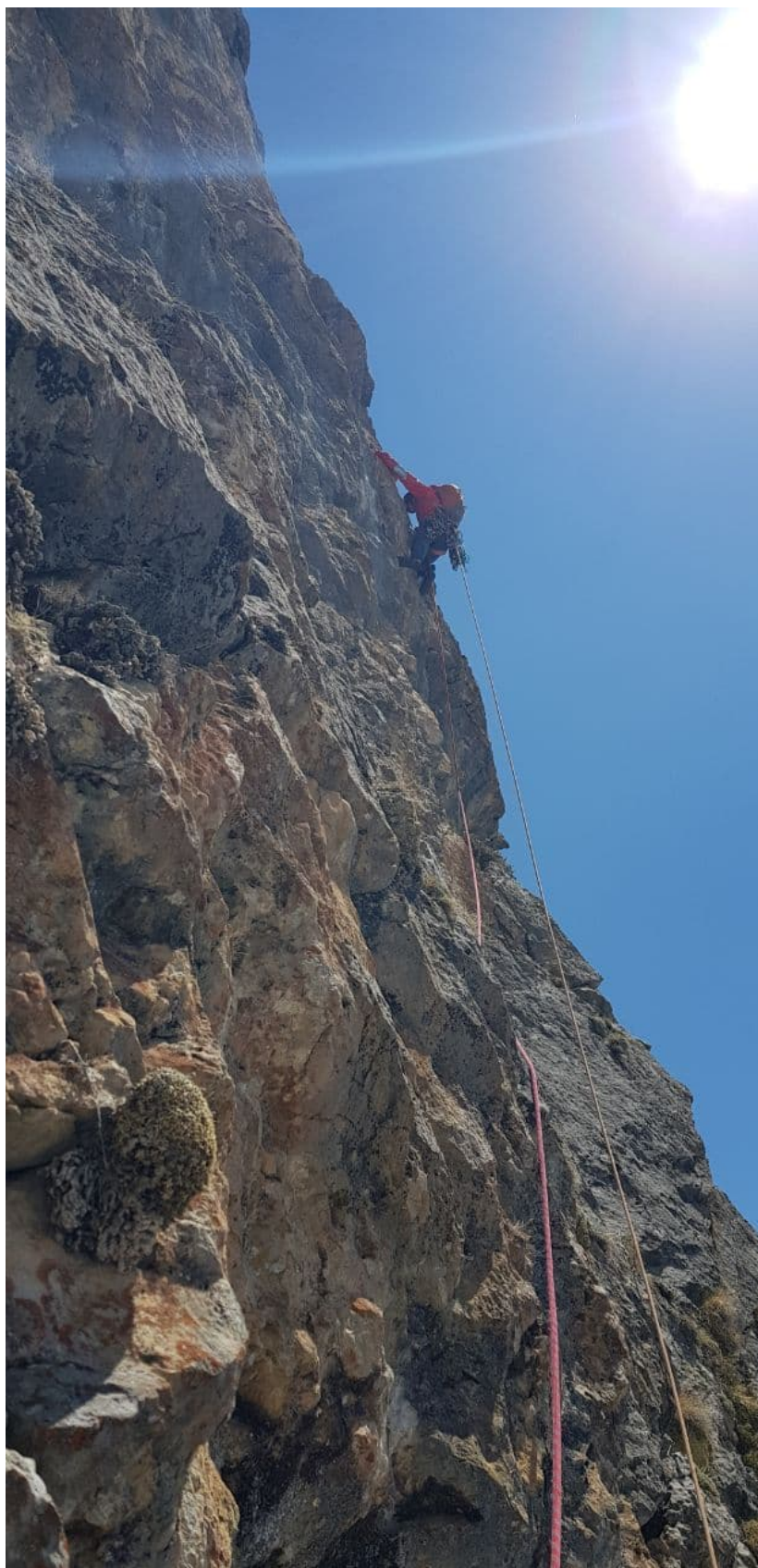
Рис. 8: Участок R0-R1