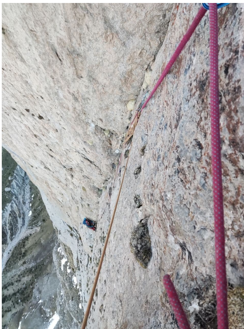
Рис. 18: Работа второго на R16-R17