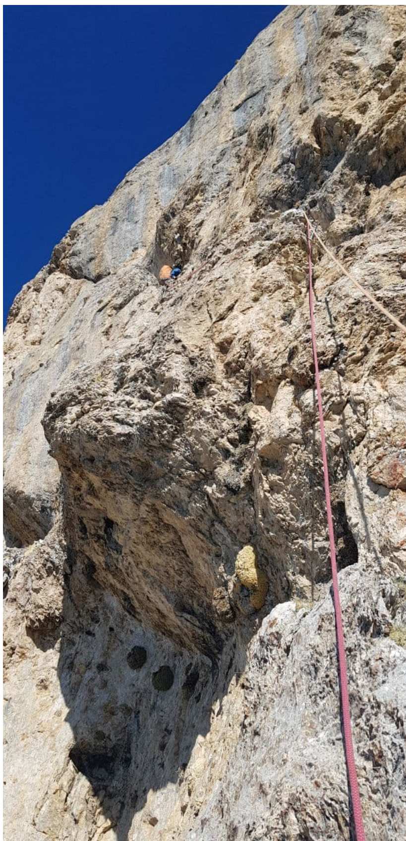
Рис. 21: Начало работы на ключевой веревке R18-R19. В верхней части виден камин