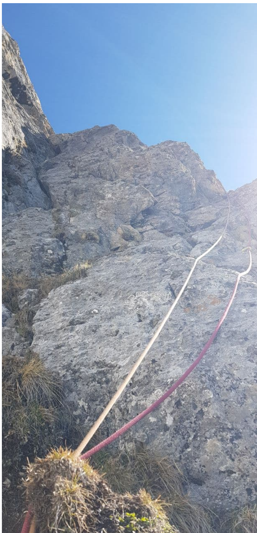
Рис. 14: Работа на участке R10-R11. Лезть необходимо по правой стороне семерки