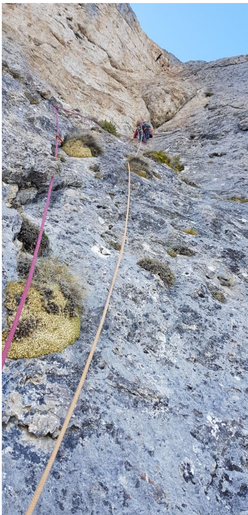
Рис. 16: Начало работы на R14-R15, Движение слева от внутреннего угла по стенкам с кавернами