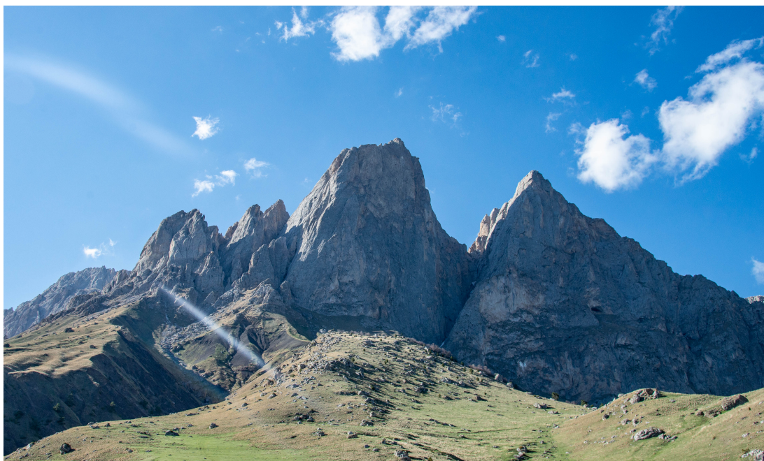
Рис. 3: Панорама району