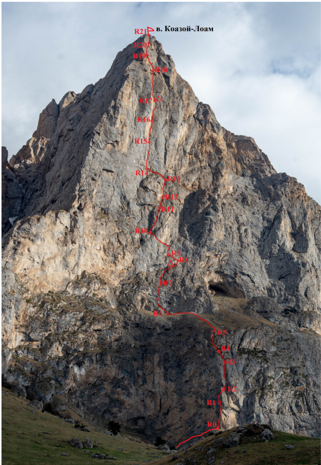
Рис. 4: Техническое фото маршрута