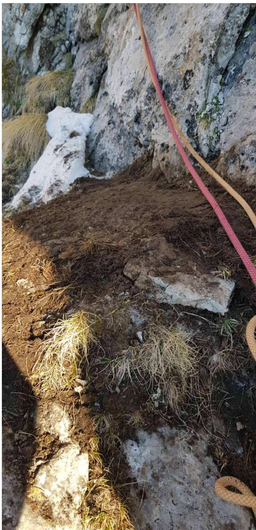
Рис. 19: Сидячая ночевка на R17