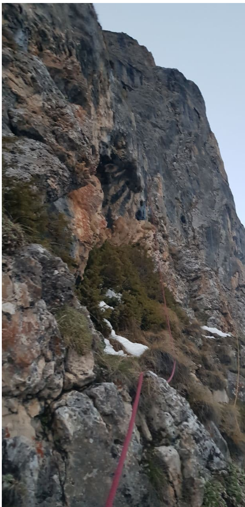
Рис. 11: Вид грота на участке R7-R8