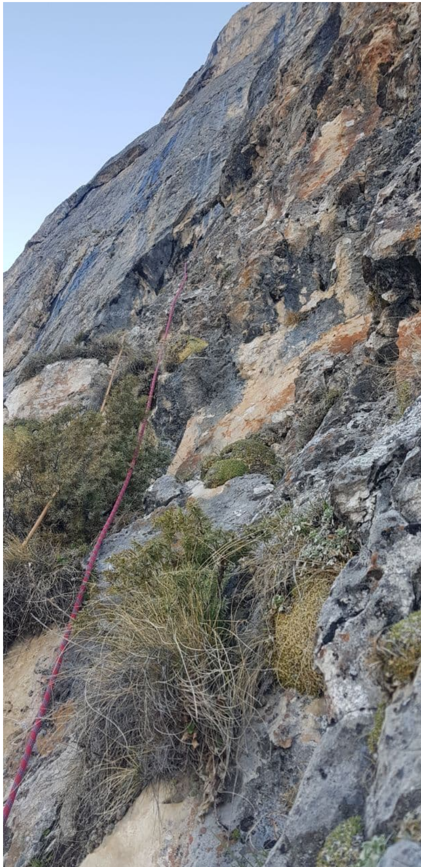
Рис. 10: Участок R6-R7