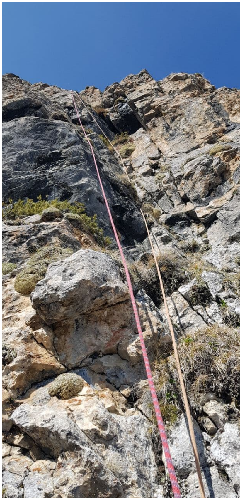
Рис. 9: Участок R4-R5