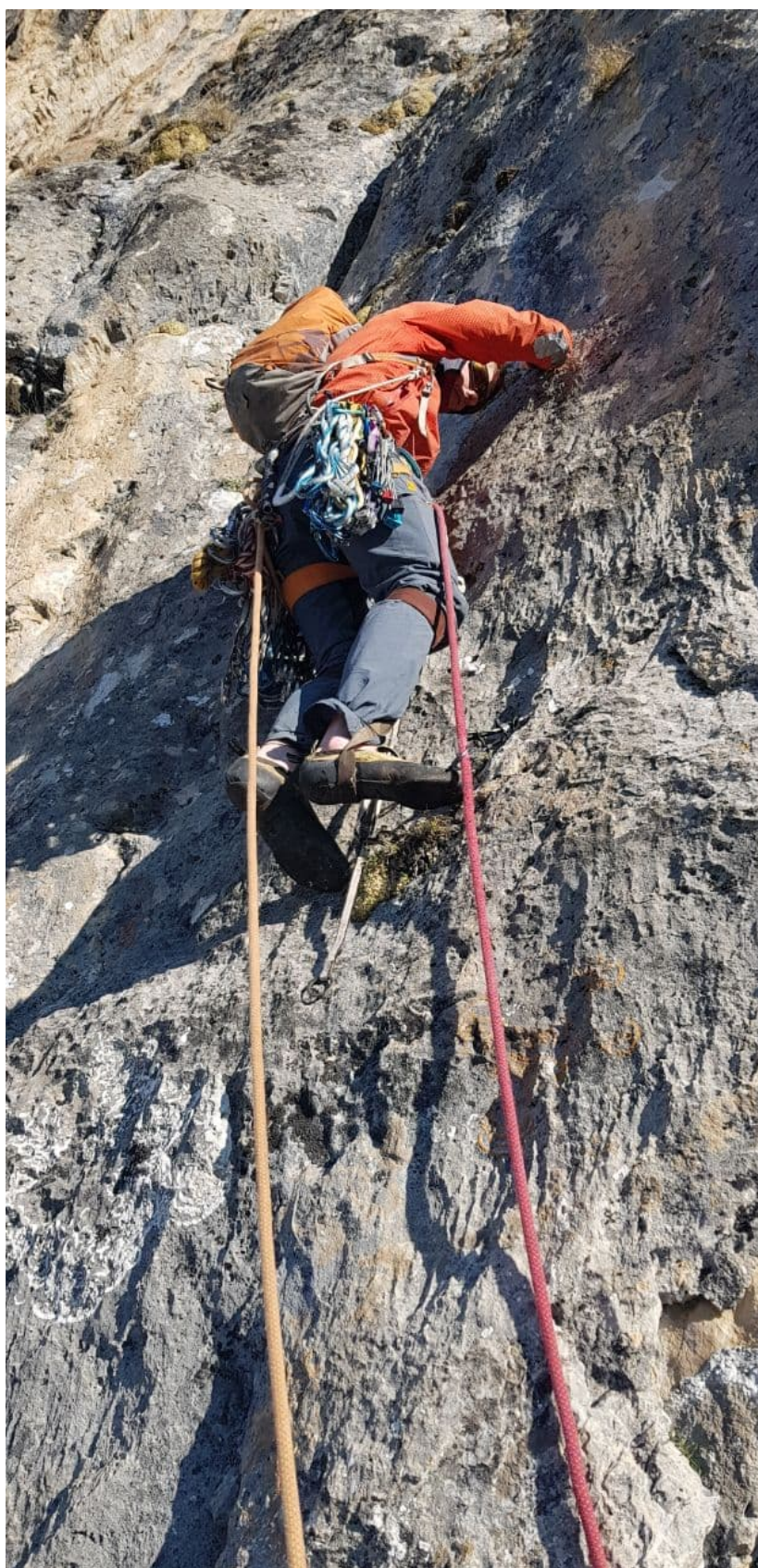
Рис. 13: Работа на участке R8-R9