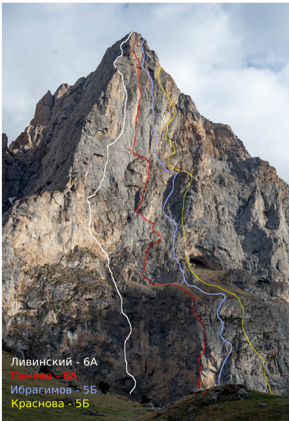
Рис. 1: Общее фото вершины