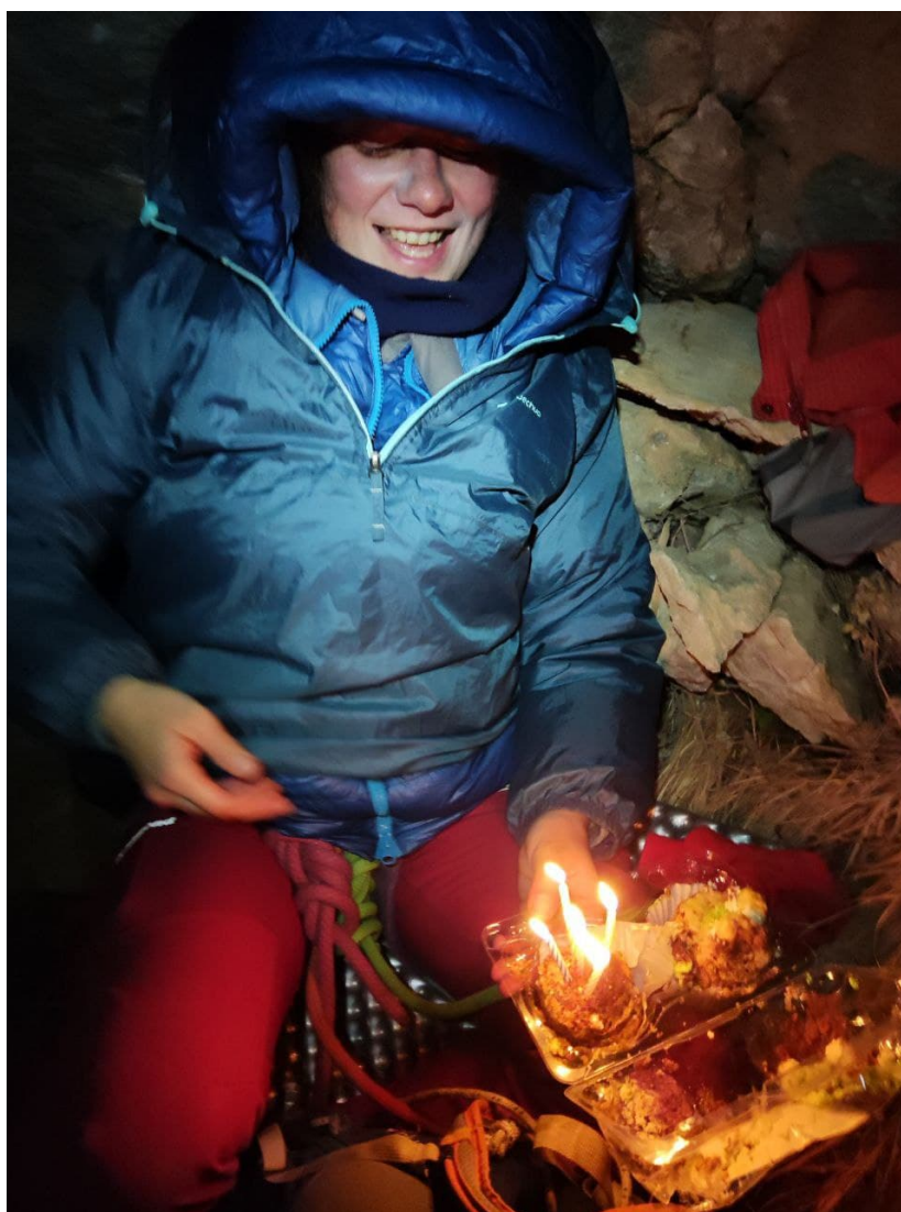
Рис. 12: Ночевка в гроте между R7 и R8