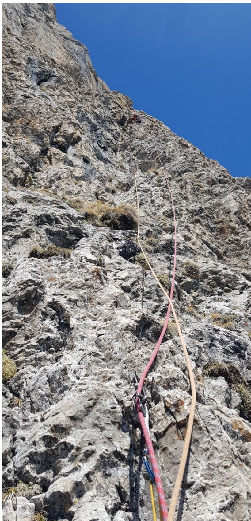
Рис. 15: Работа лидера на R12-R13