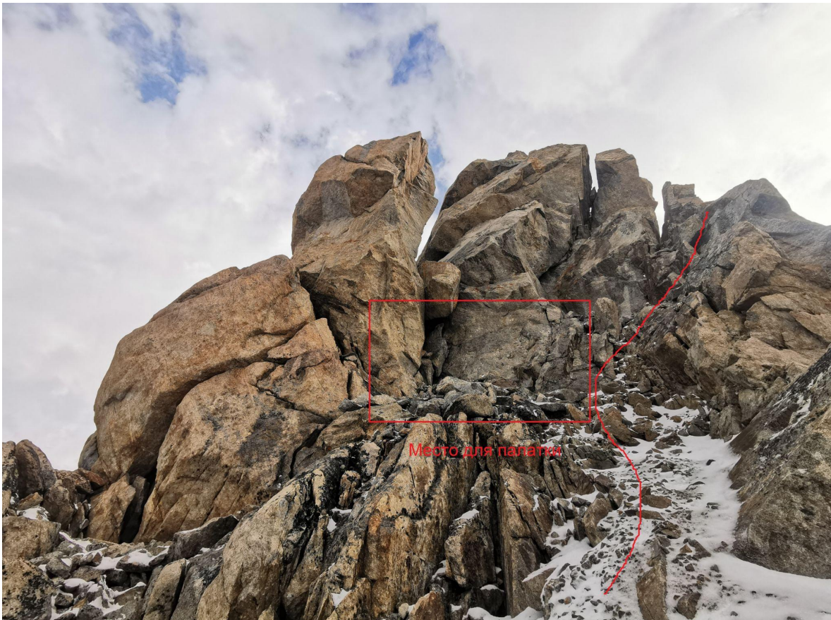
Место ночёвки R17