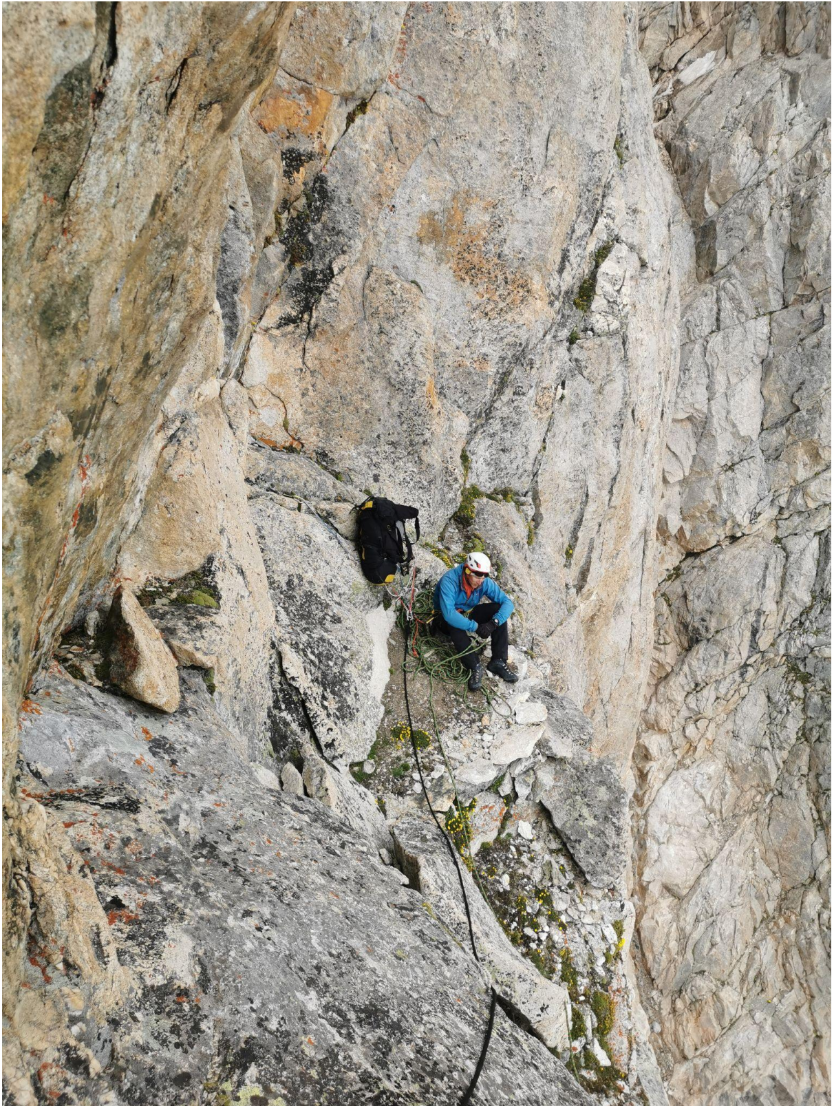
Вид на станцію R5