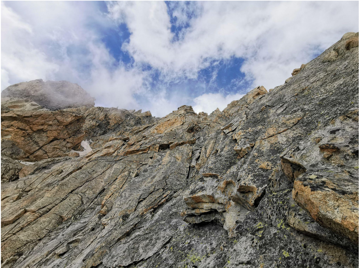
Широкий гребень. Участки R8-R12