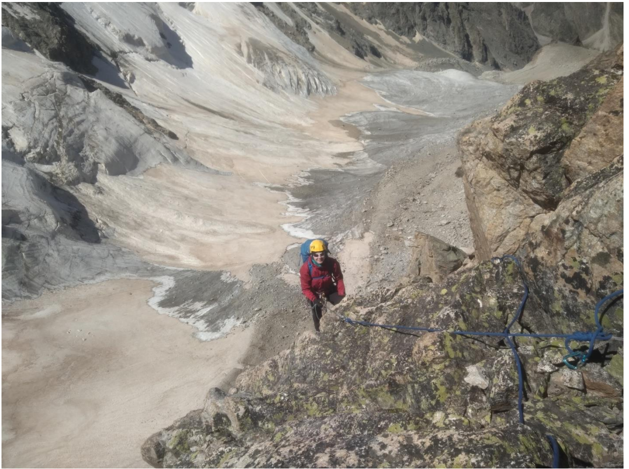
Фото R6-R7 выход на гребень