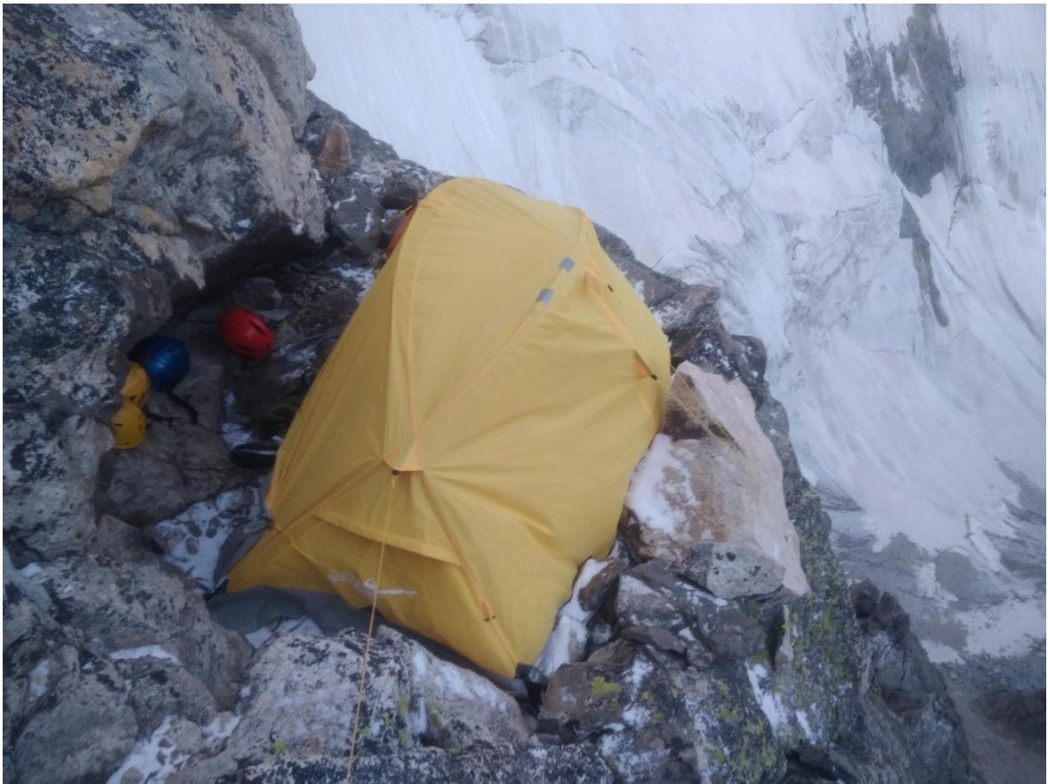
Фото ночевки на маршруте