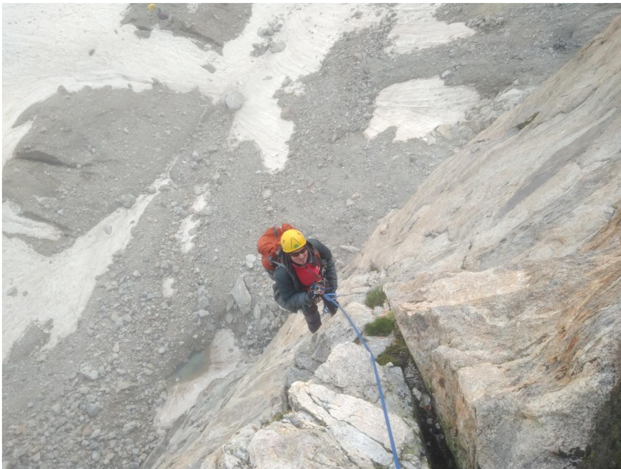
Перила R1-R2. На фотографии видны палатки под маршрутом