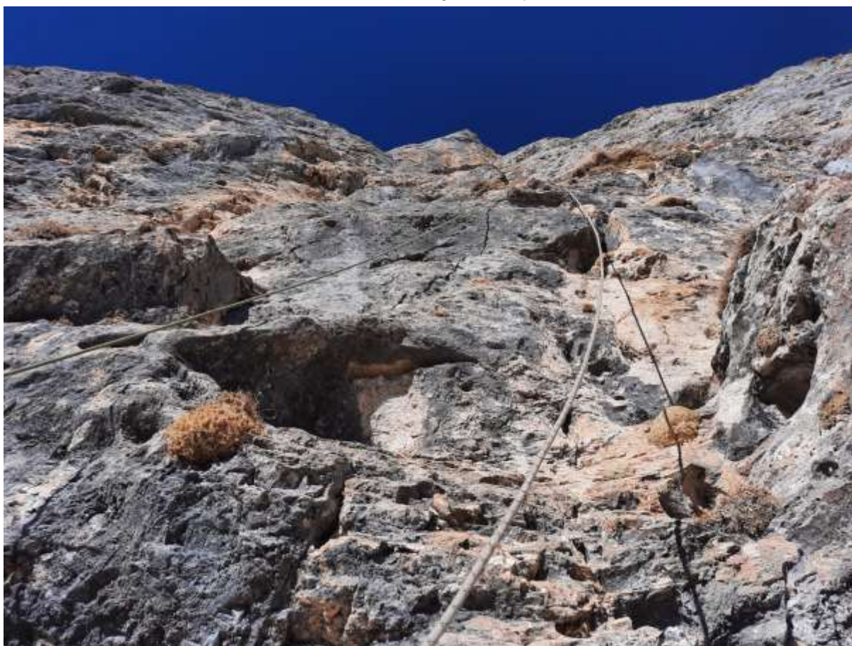
Фото №11 – R14. Участок R14-R15.