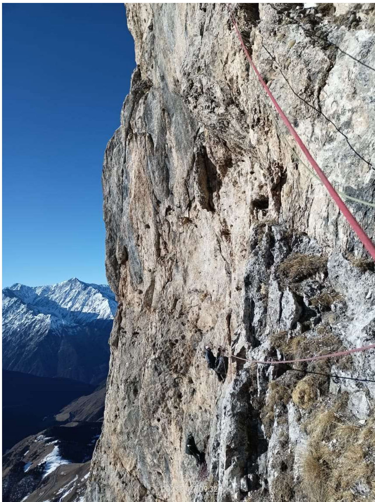
Фото №13 – Участок R18-R19. Начало. Вид со станции R18.