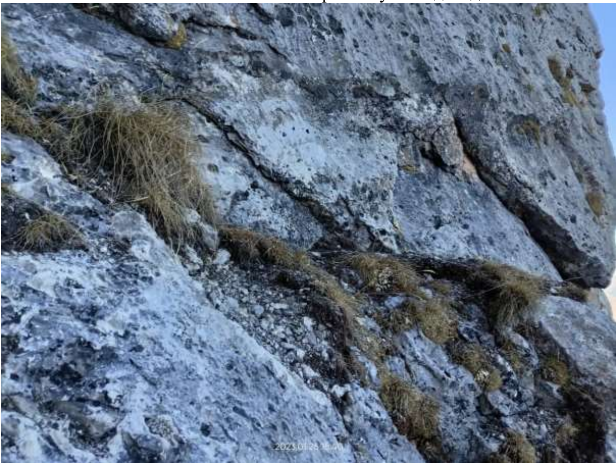
Фото №15 – Возможная сидячая ночевка правее R17.