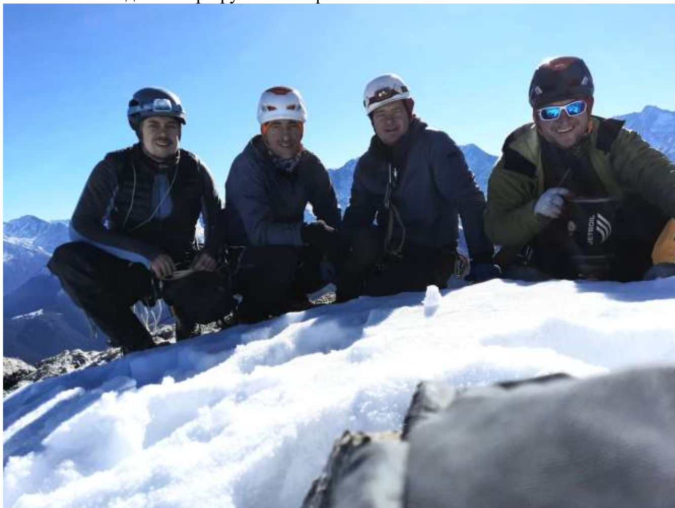
Фото №1 – На вершине.