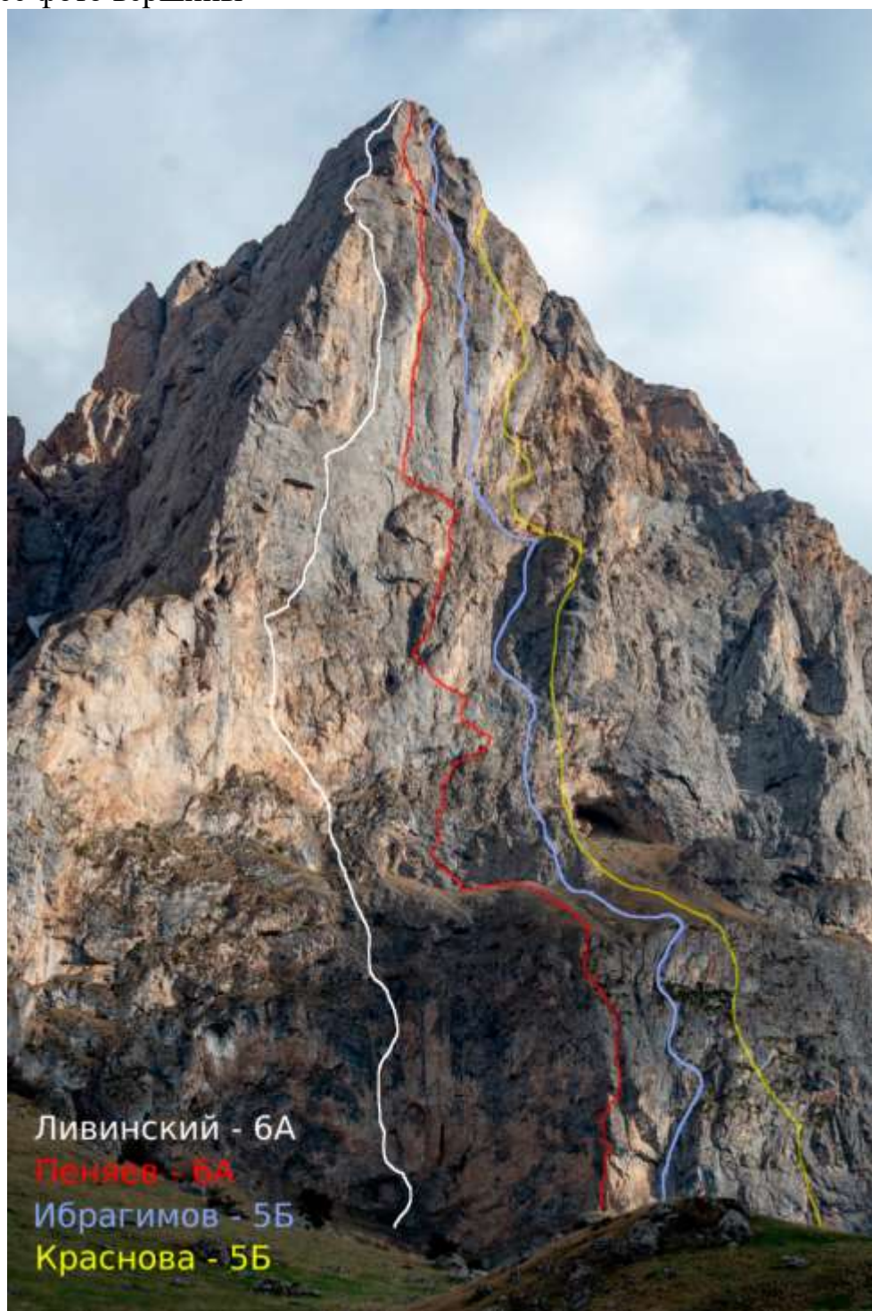
Пройденный маршрут на фото «Пеняев 6А».