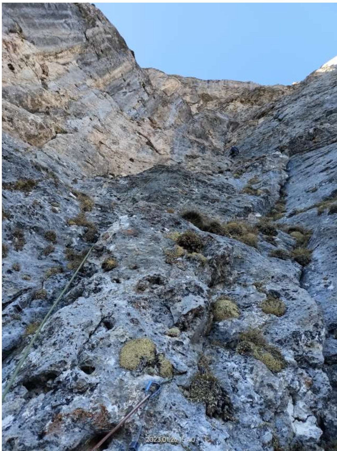
Фото №12 – Участок R17-R18. Вид со станции R17.