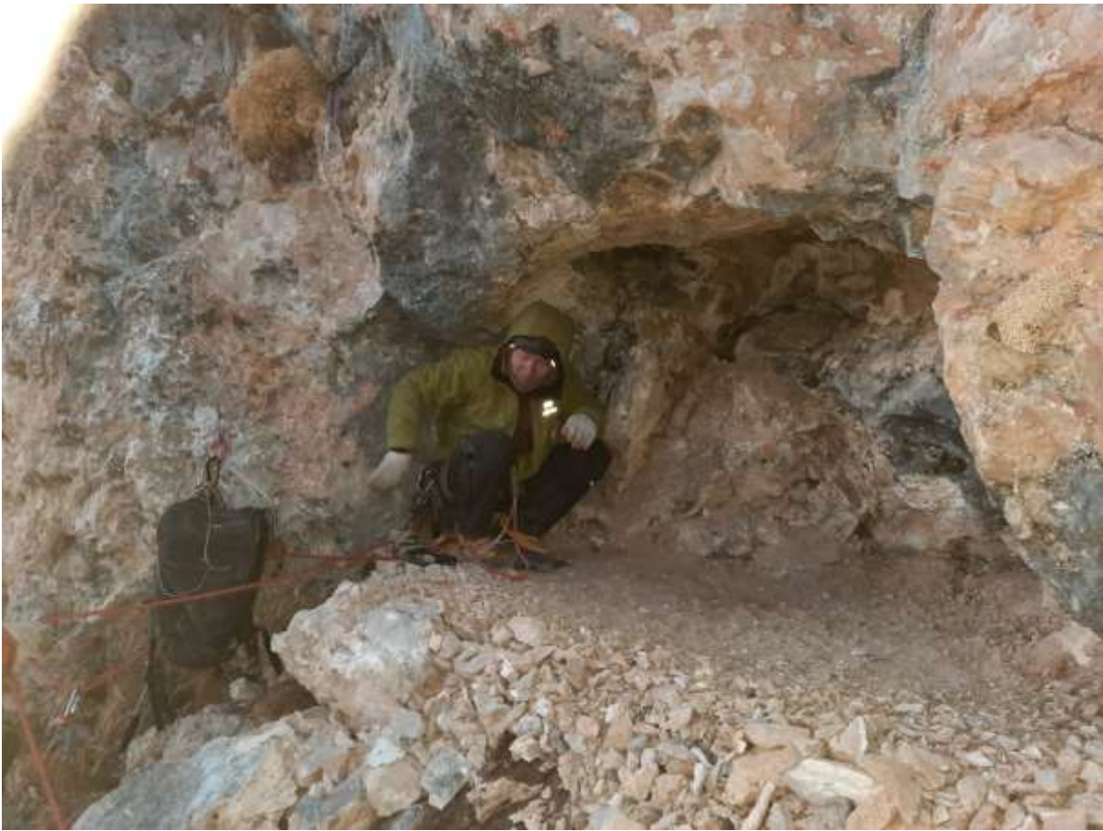
Фото №14 – Ночевка в гроте. Чуть не доходя R14.