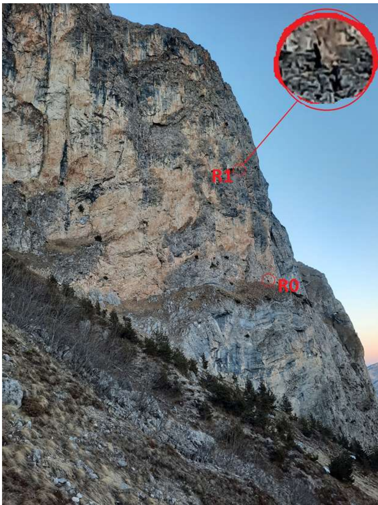
Фото №4 – Участок R0-R1. Обработка в 1й день.