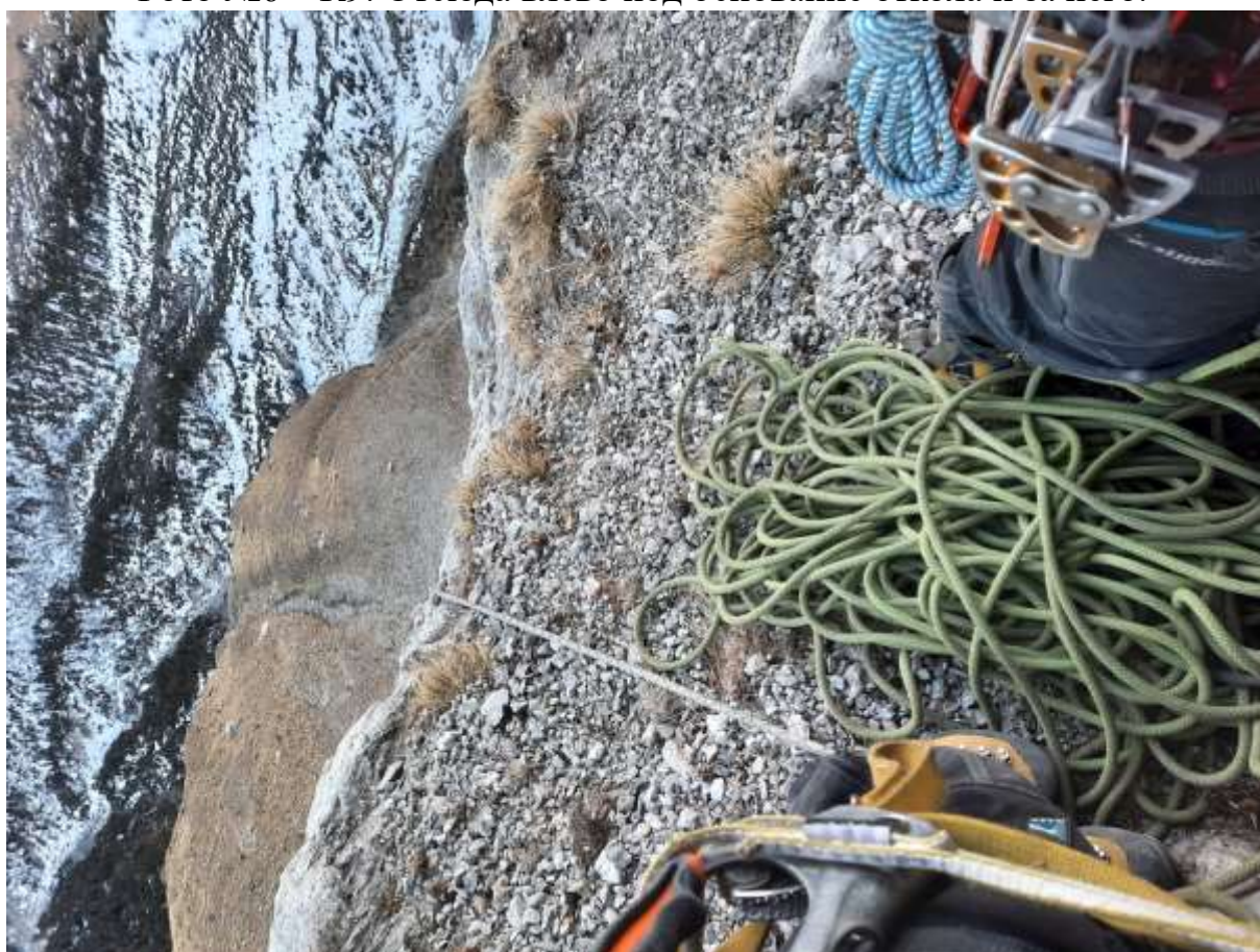
Фото №7 – R9. Вид вниз на R8.