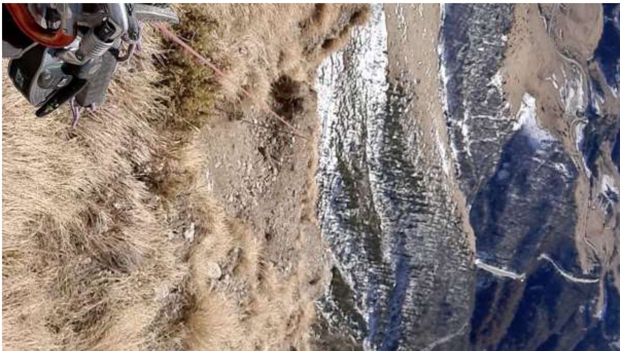
Фото №8 – R13. Вид вниз на R12.