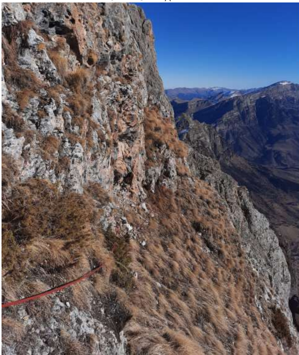
Фото №9 – R14. Траверс. Вид с R14.