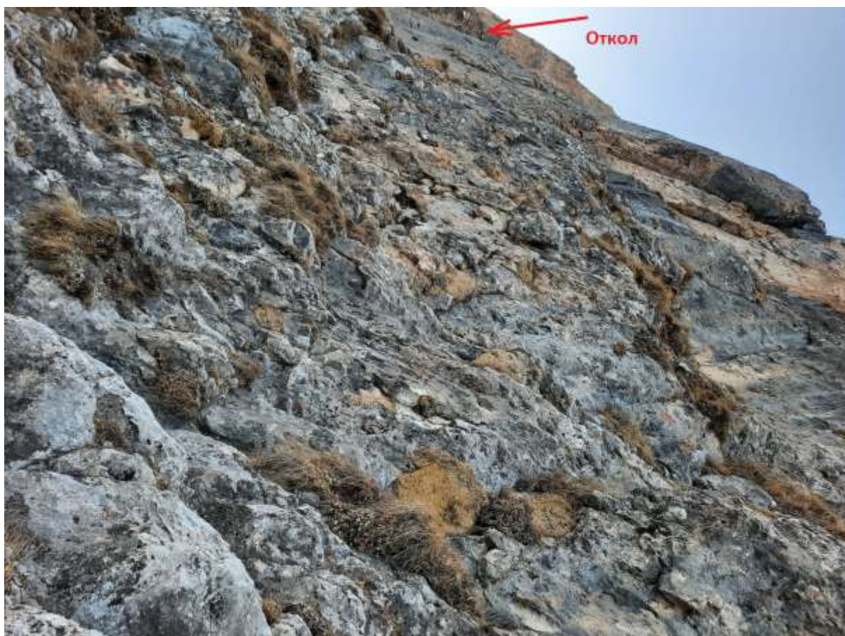
Фото №6 – R9. Отсюда влево под основание откола и за него.