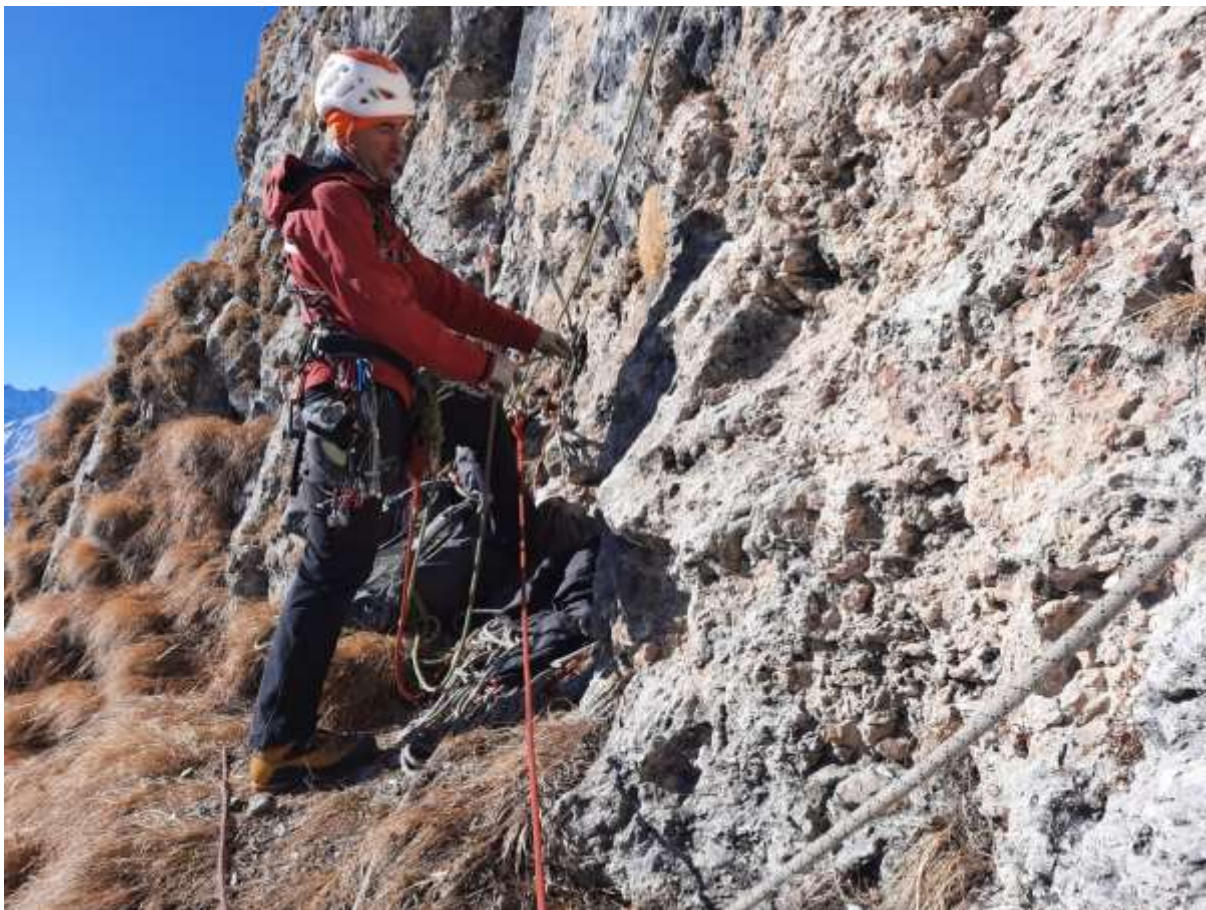
Фото №10 – R14.