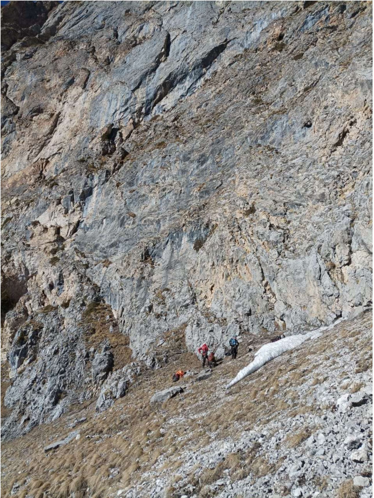
Фото №5 – R6. Терраса.