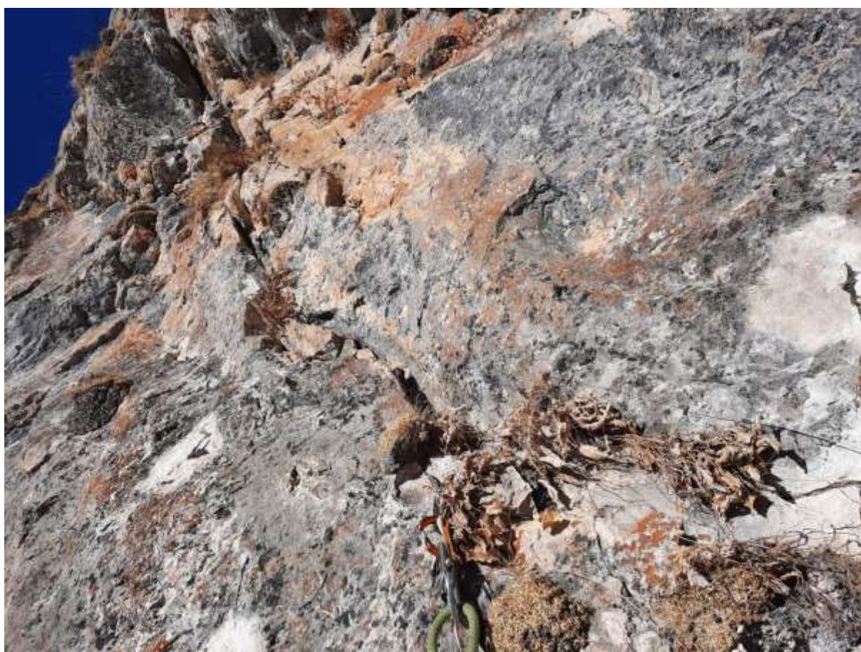
Фото №3 – Вид с R1 Вниз и вверх.