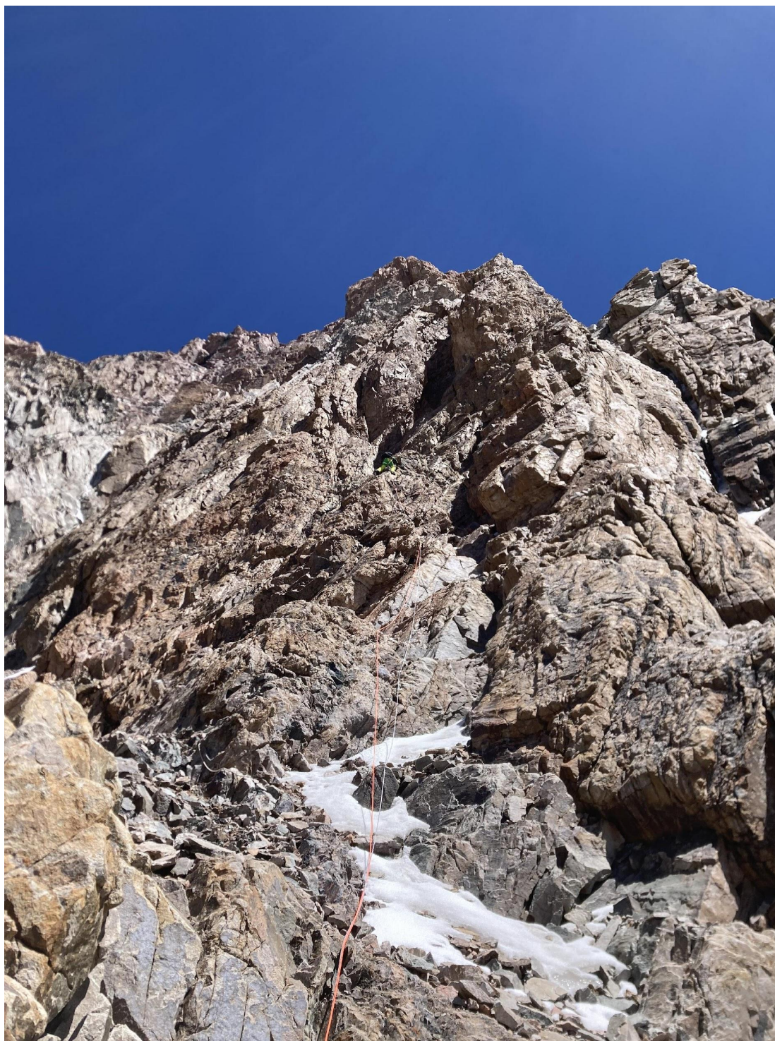
Фото 13 – Лезем в направлении большого отлома

Затем несколько веревок лазания средней трудности логично вверх, после чего неприятная веревка с поясом отламывающихся зацепов, сосульками и льдом на полочках.