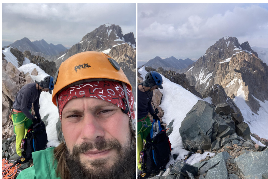
Фото 14 – Группа на вершине, вершинный тур

3.2. Фото команды на вершине приведено ниже, записка в вершинном туре от предыдущей группы отсутствовала.