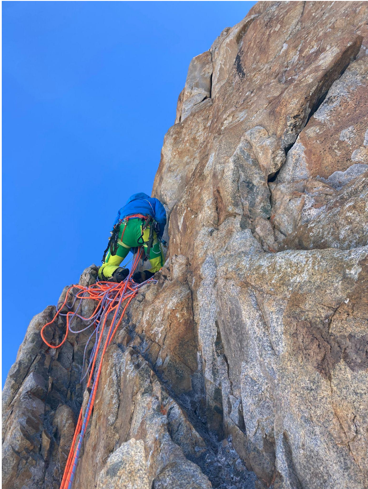
Фото 11 – Станция перед второй частью ключевой веревки

После прохождения ключа основные технические трудности маршрута окажутся позади, но впереди – основной набор высоты и долгий путь по