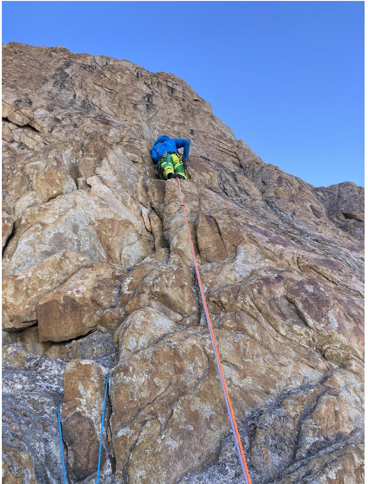
Фото 10 – Первая половина ключевой веревки