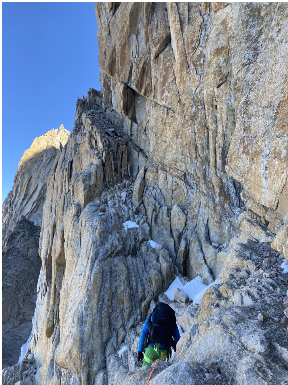
Фото 9 – Со “станции на шлямбурах”. Простая полка, выводящая под второй ключ.

Станция на шлямбурах – отличный ориентир, поскольку стена изобилует одинаковыми внутренними углами и пешеходными горизонтальными полками (фото 9) и в них легко заблудиться. Сама станция находится немного справа от маршрута (в 10 метрах), возможно ее придется поискать.