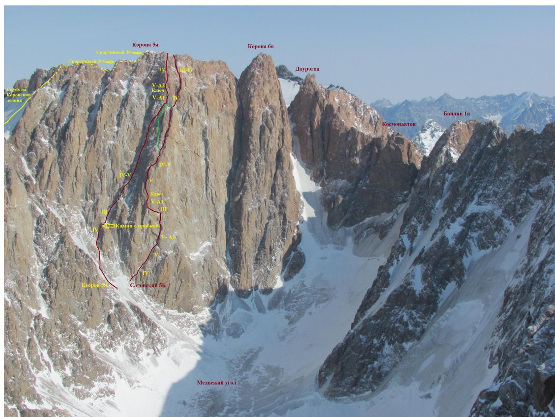
Фото 1 – Вид на маршрут и в. Корона 5-я