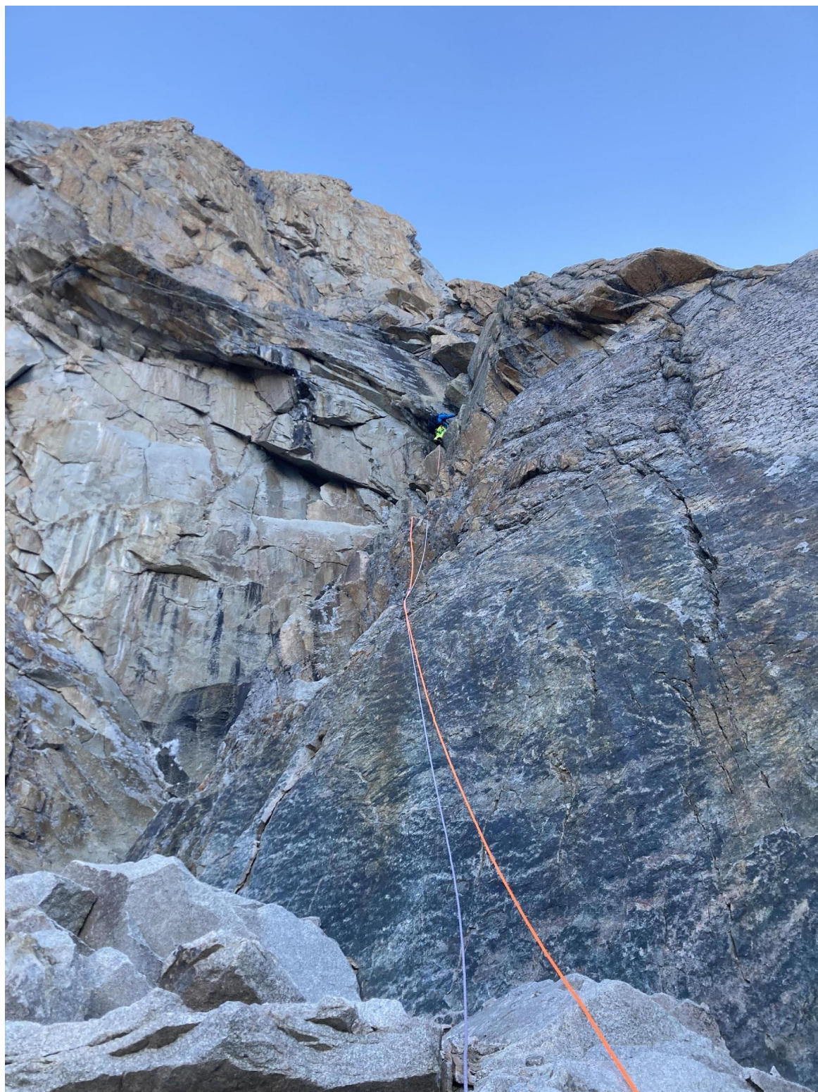
Фото 7 – Сложный внутренний угол, первый ключ

самая сложная на маршруте и если лезть ее свободным лазанием, то это будет 6b/6c, но самые сложные перехваты легко можно заИТОшить. Станция на своих точках.