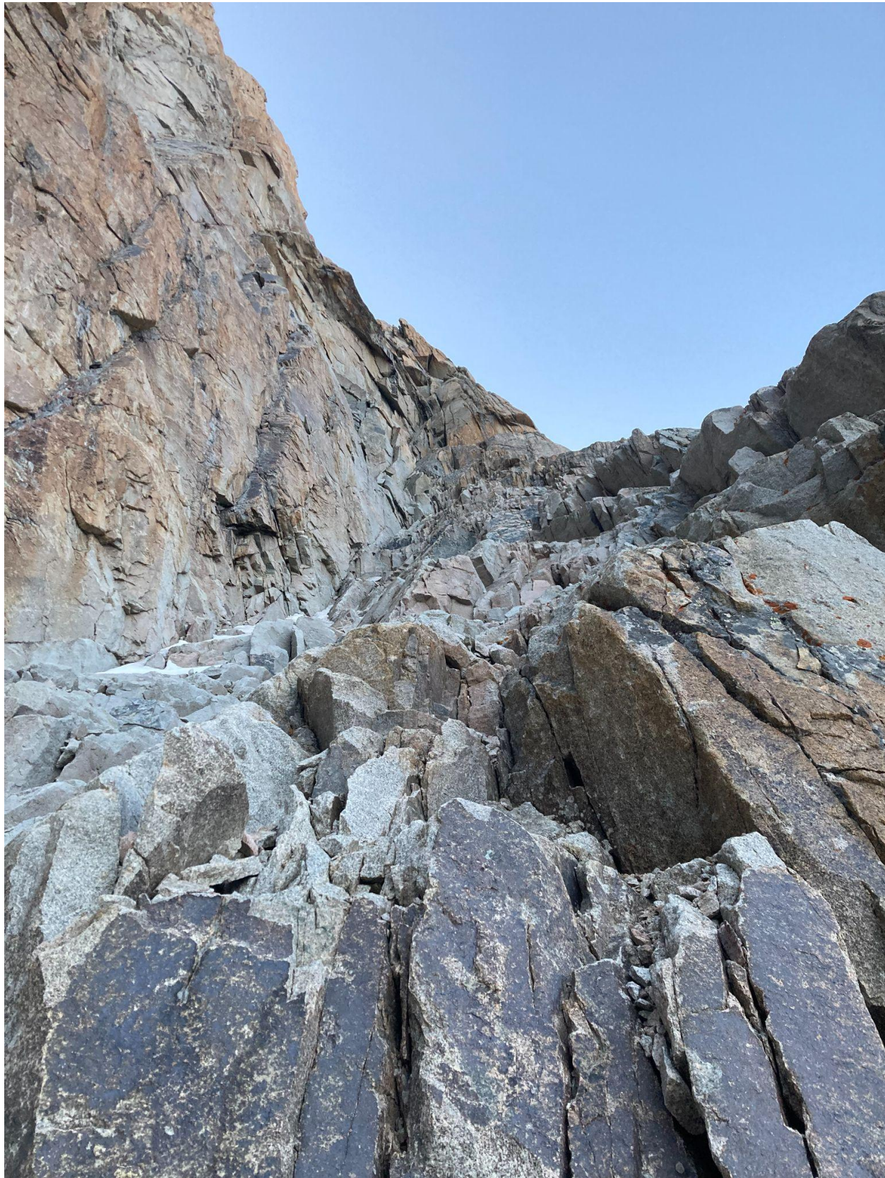
Фото 6 – Простой внутренний угол

Далее рельеф становится на гораздо круче и сложнее. Уже не остается вариантов лавировать вправо-влево и нужно лезть прямо вверх по внутреннему углу (фото 7). По нашим ощущениям именно эта веревка –