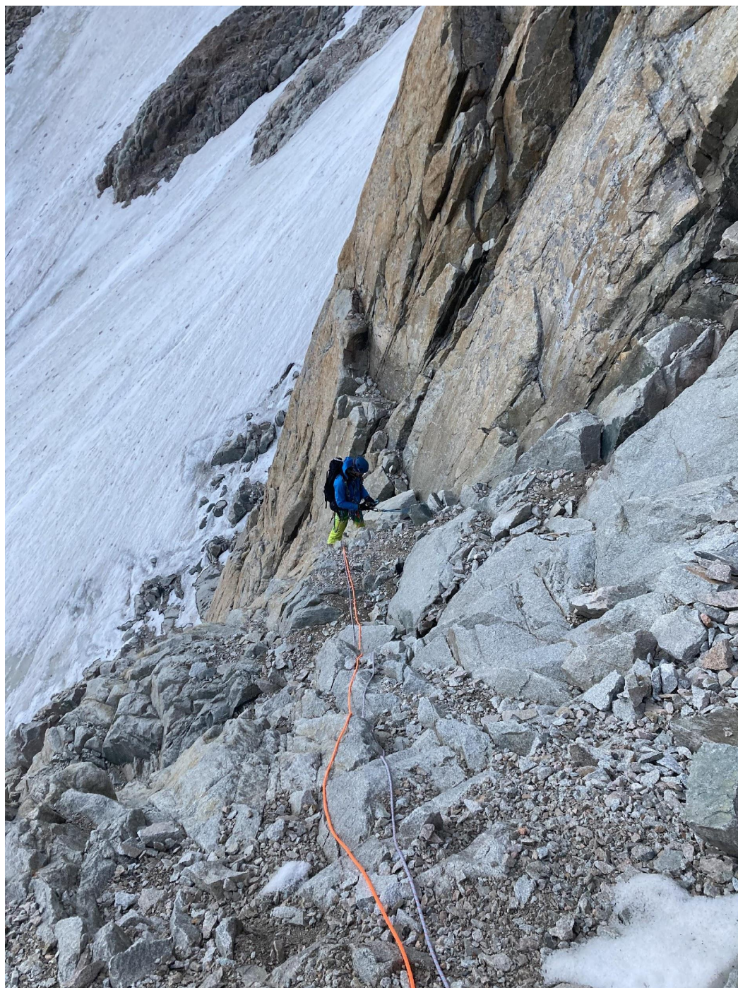
Фото 5 – Простая полка, выводящая под внутренний угол

По простой полке (фото 5) подход под явно выраженный внутренний угол (фото 6). Далее, можно лезть либо по самому внутреннему углу, либо в 10-15 метрах справа, параллельно ему. И там, и там лазание простое, примерно III-IV, протяженностью около одной веревки. Мы лезли справа, поскольку внутренний угол был залит льдом.