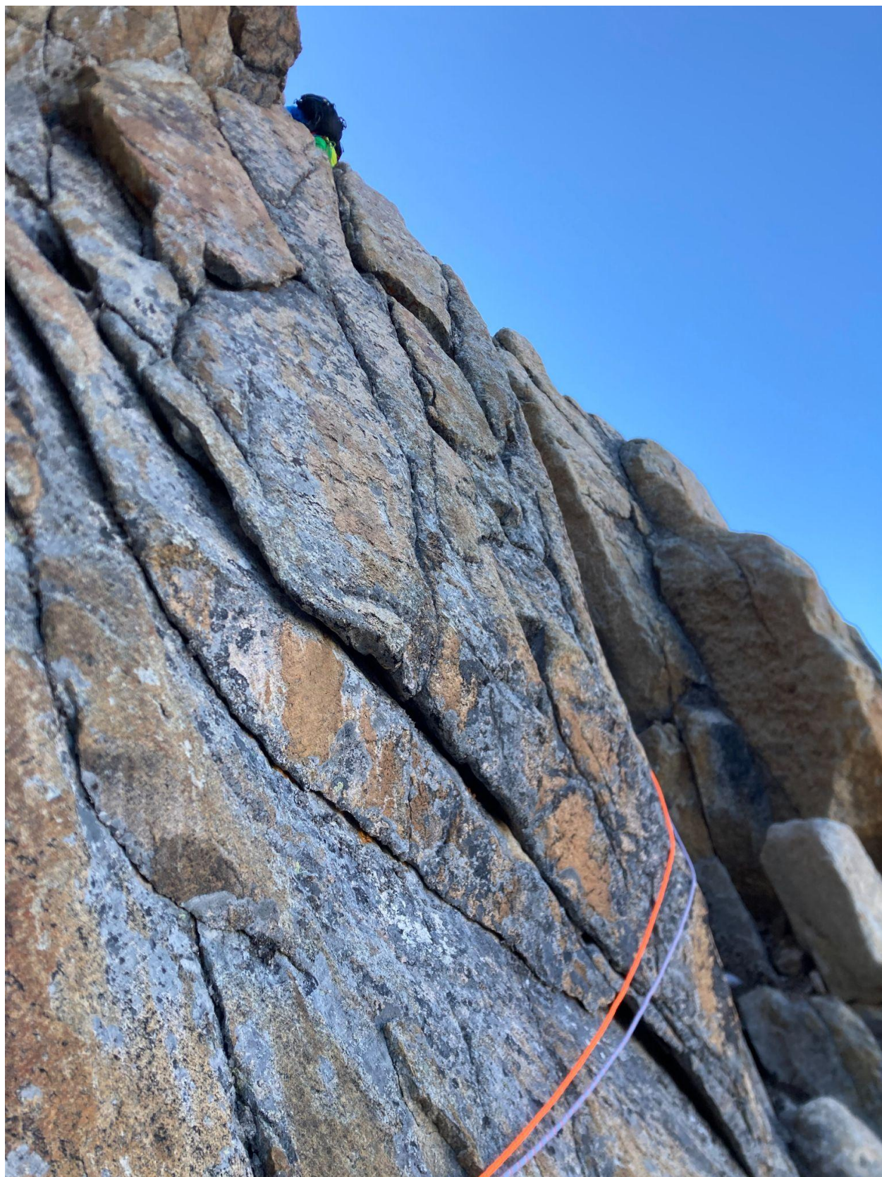
Фото 8 – Со станции, после сложного внутреннего угла

Далее внутренний угол переходит в крутую стену с расходящимися внутренними углами (фото 8). Лезть нужно вверх и немного вправо, выбирая самый простой путь. Протяженность участка – около веревки, сложность V/V+. Станция на шлямбурах.