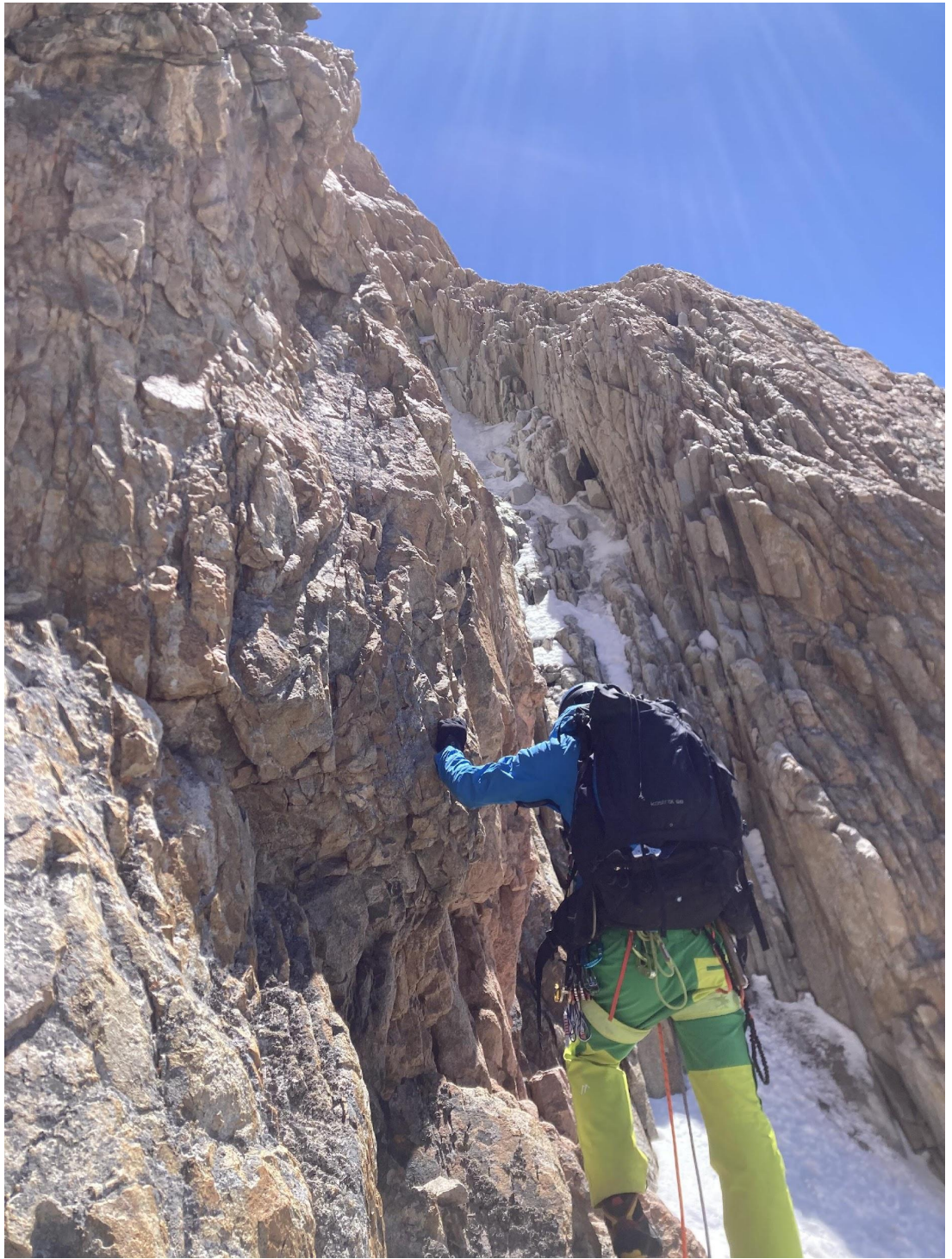
Фото 12 – Сложное лазание слева от кулуара