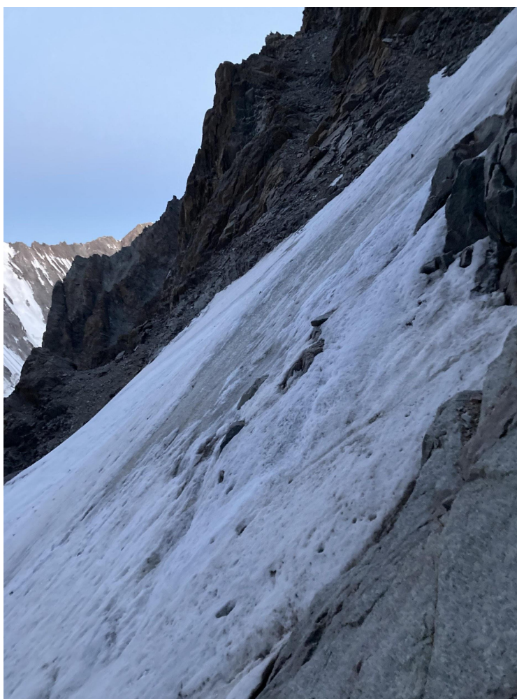
Фото 3 – Снежно-ледовый склон с первой станции на скалах

04 августа в 3:00 вышли с Коронской хижины и подошли под начало маршрута около 4:30. Далее преодолели взлет снежно-ледового склона (около 200 метров фирн, снег, лёд) и около 5:30 подошли под скальную часть маршрута. Станция на ледобуре и скале.