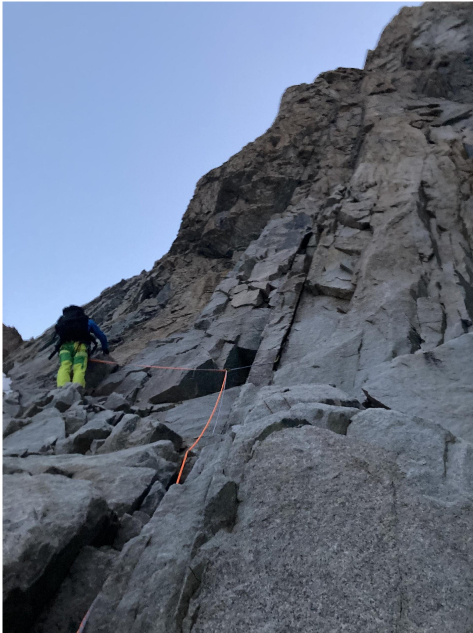
Фото 4 – Скальная стенка, выводящая на полку