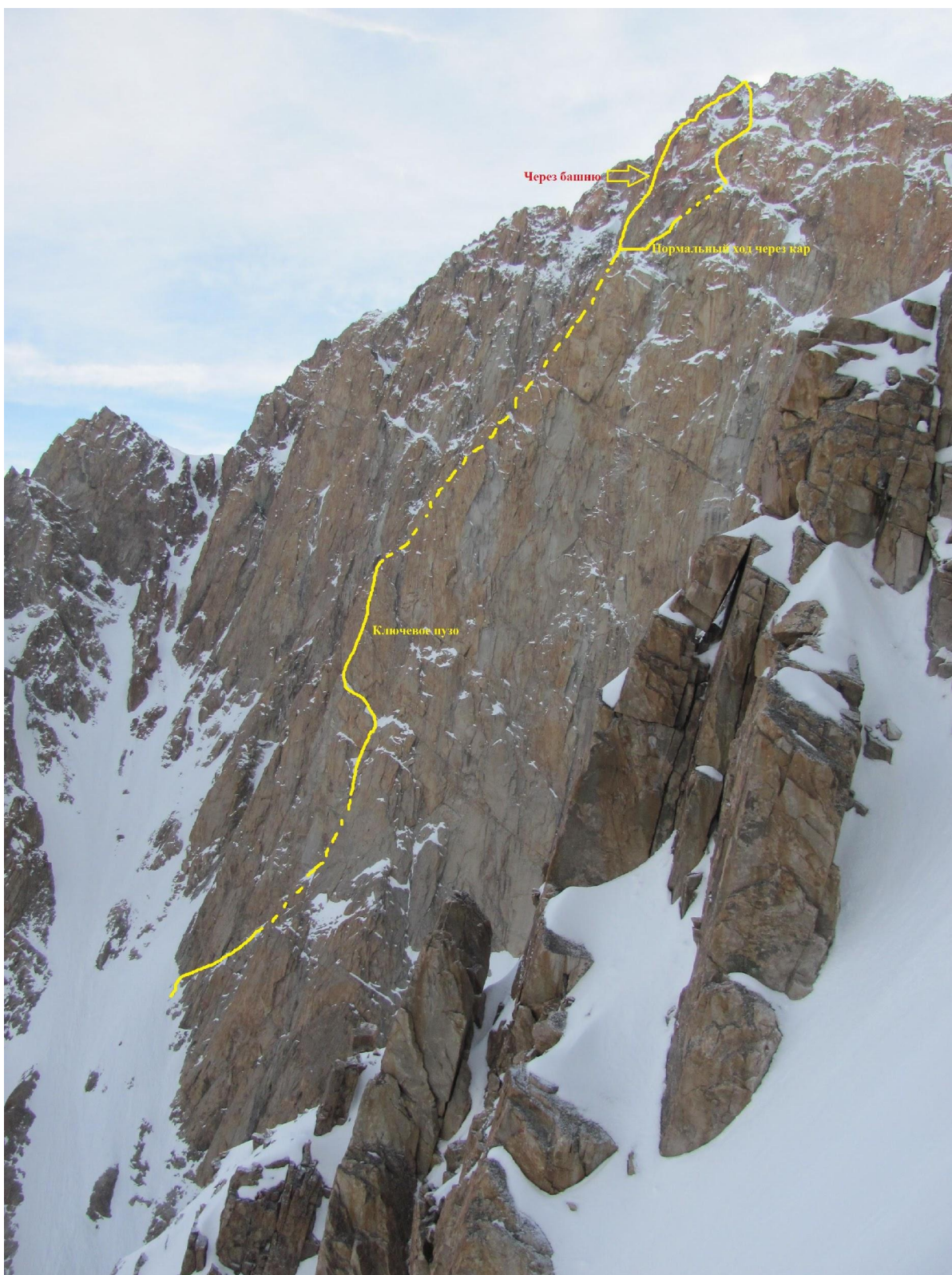
Фото 2 – Профиль маршрута и фотопанорама района с с в. Байлянбаши