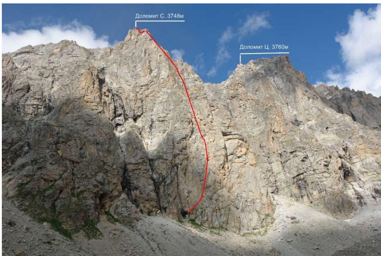
Рисунок 1 Общий вид маршрута