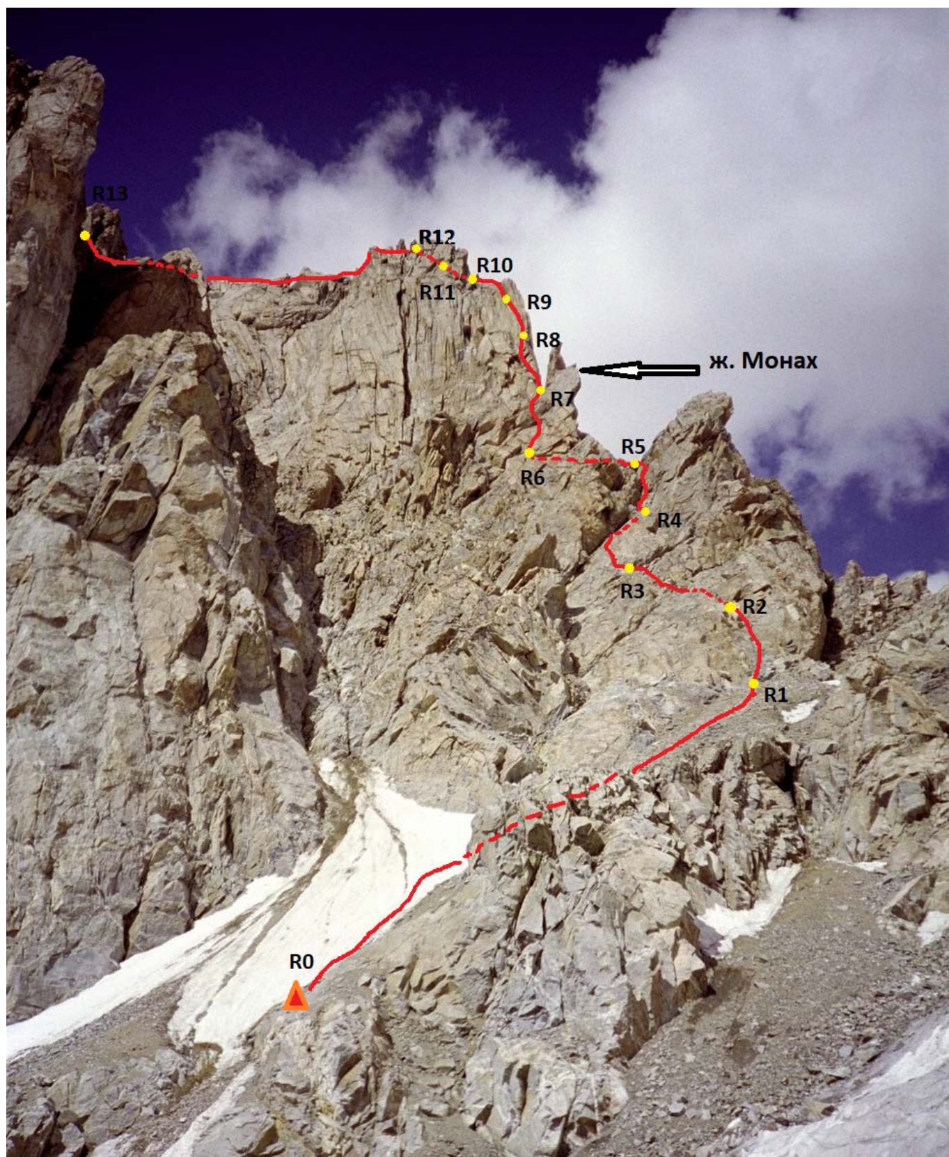
Фото основной части маршрута.