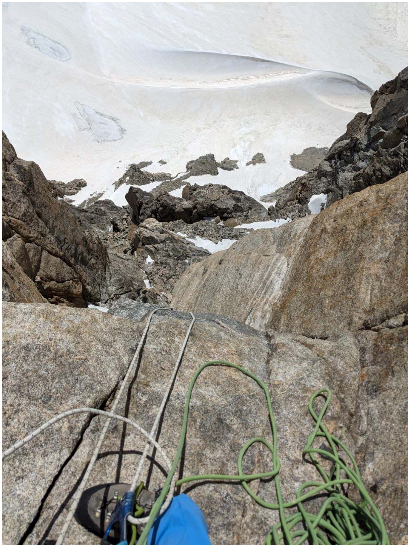
УЧАСТОК R8, вид вниз на R7.