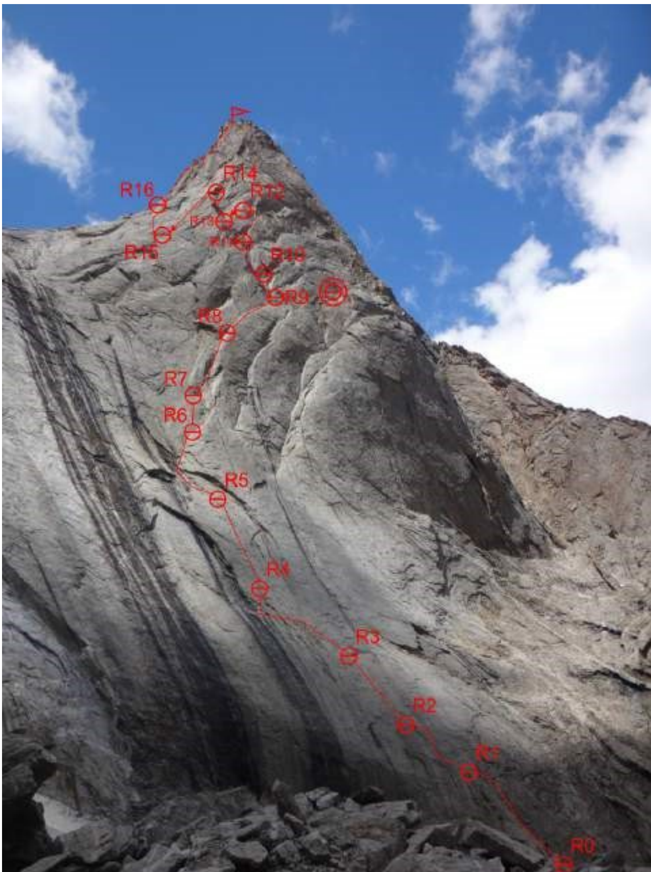
Фото 4. Техническая фотография маршрута.