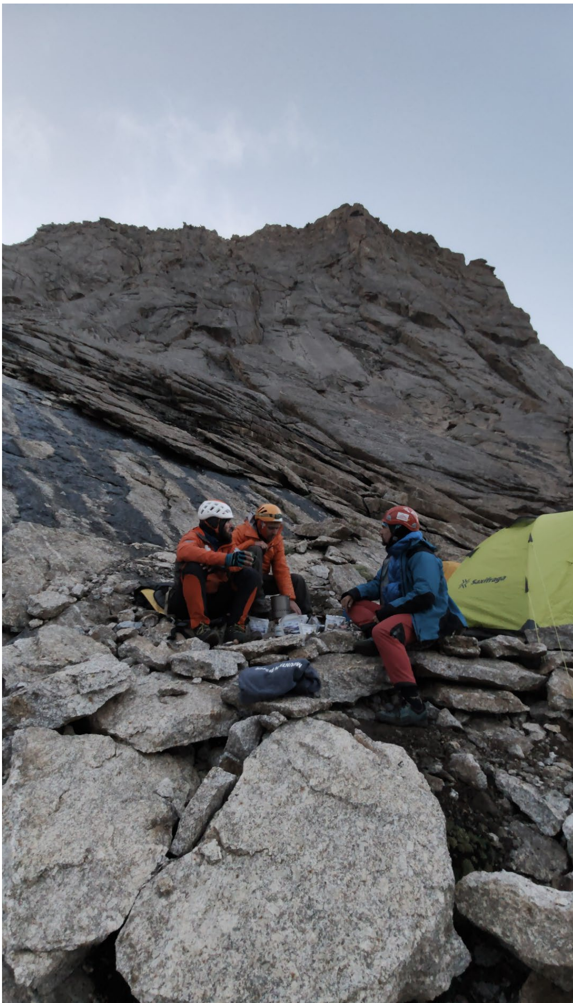
Фото 14. Бивуак на R16