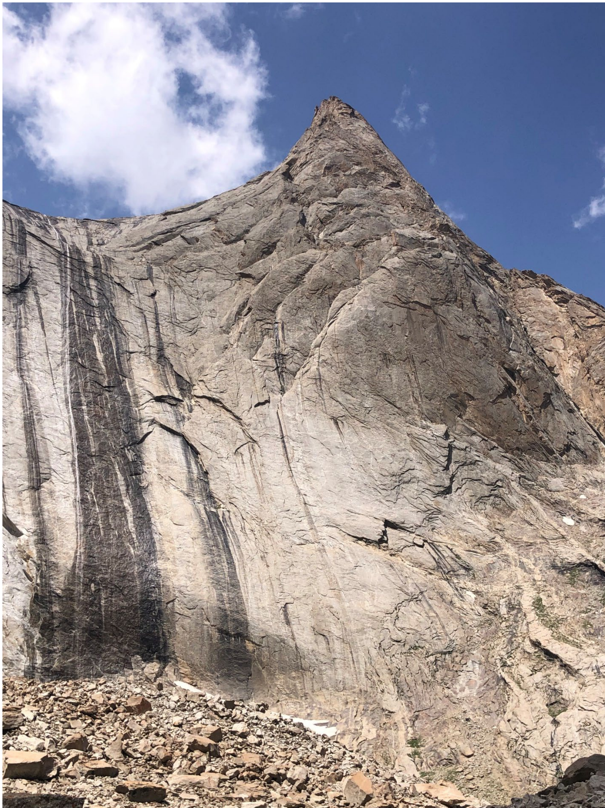
Фото 1. Общая фотография вершины.