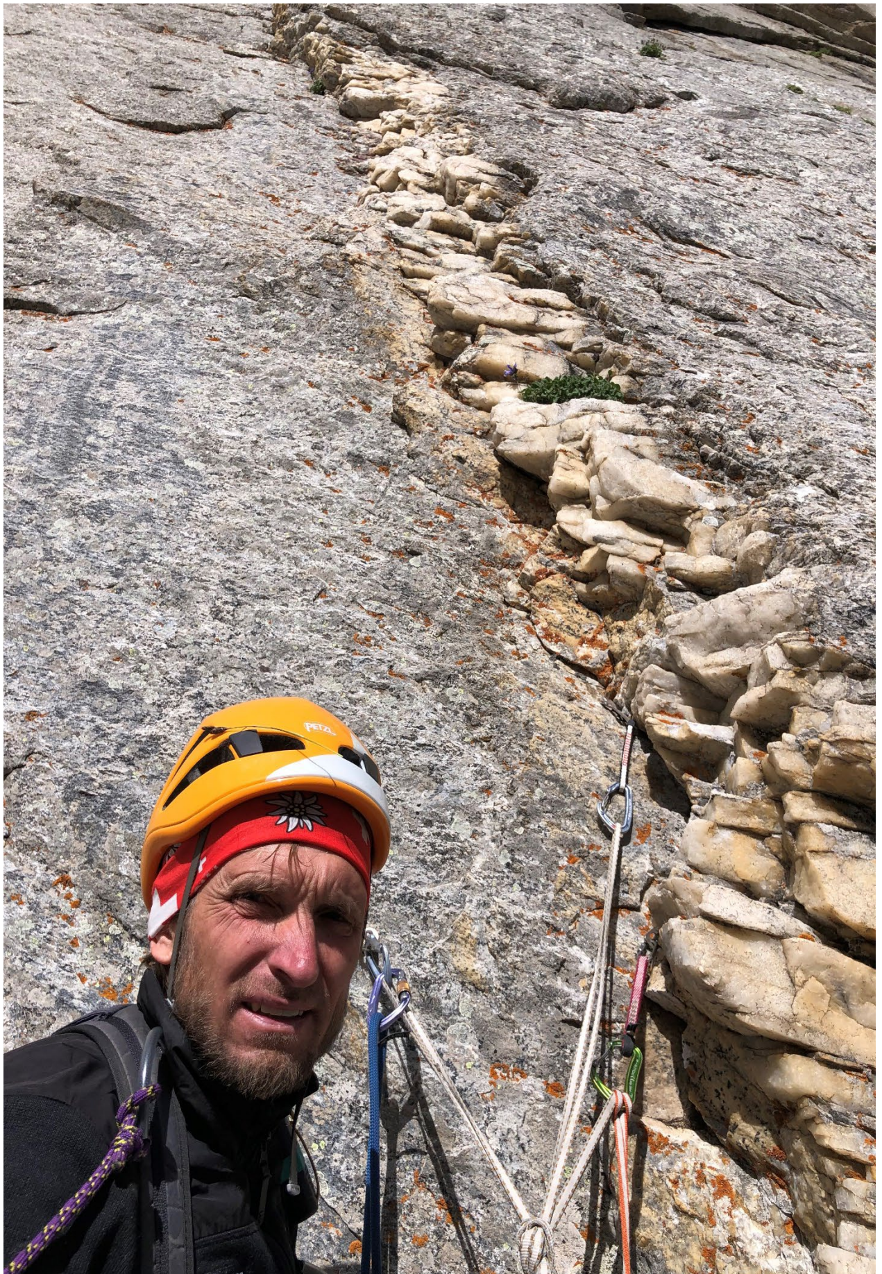
Фото 9. Станция R4