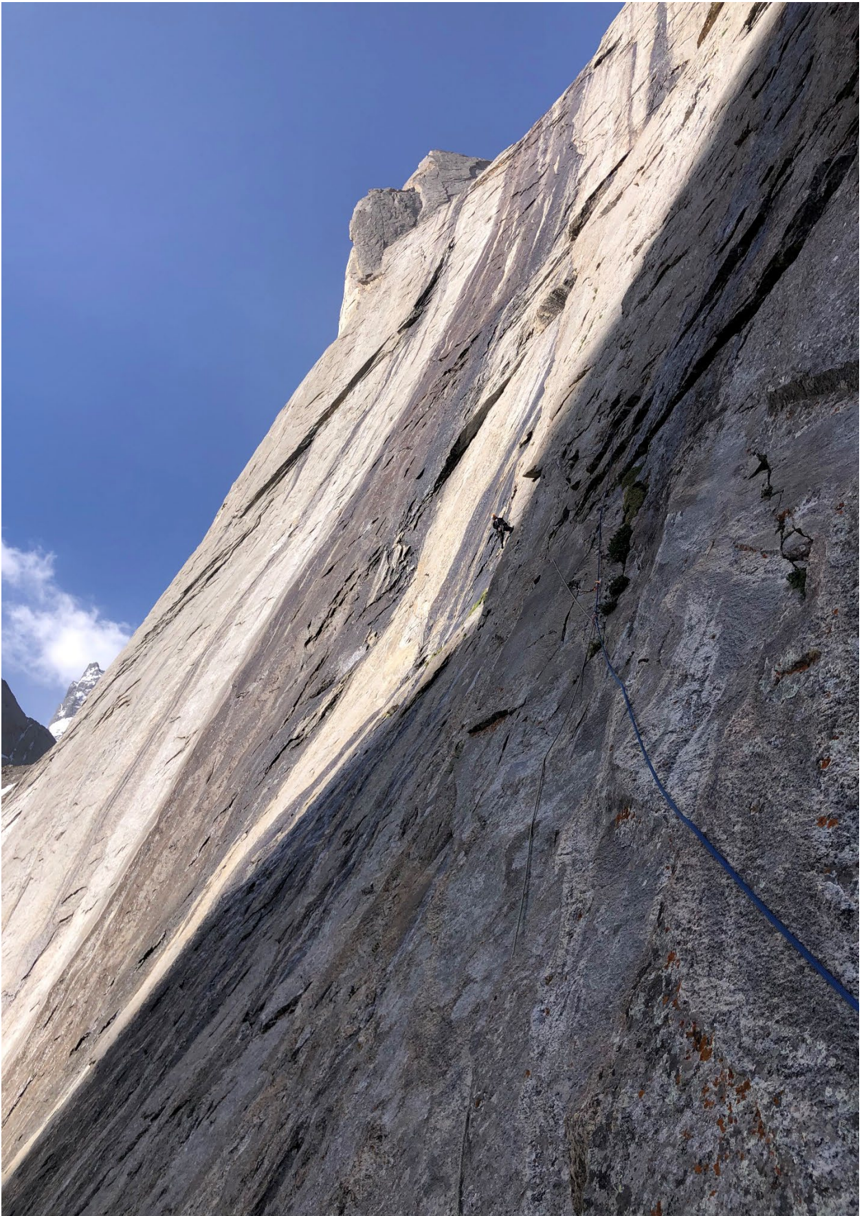
Фото 8. Участок R3 – R4