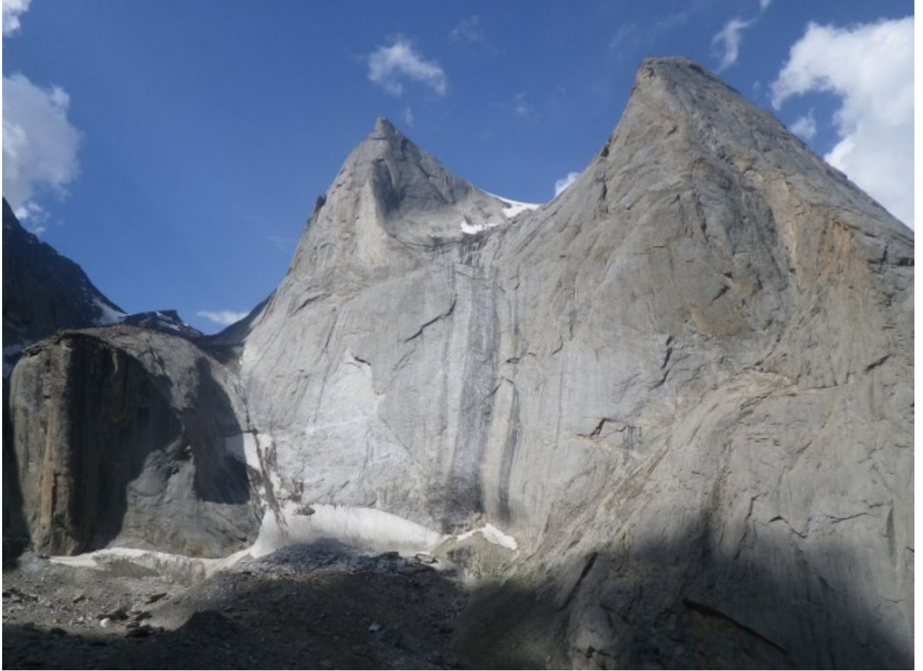
Фото 2. Профиль маршрута.