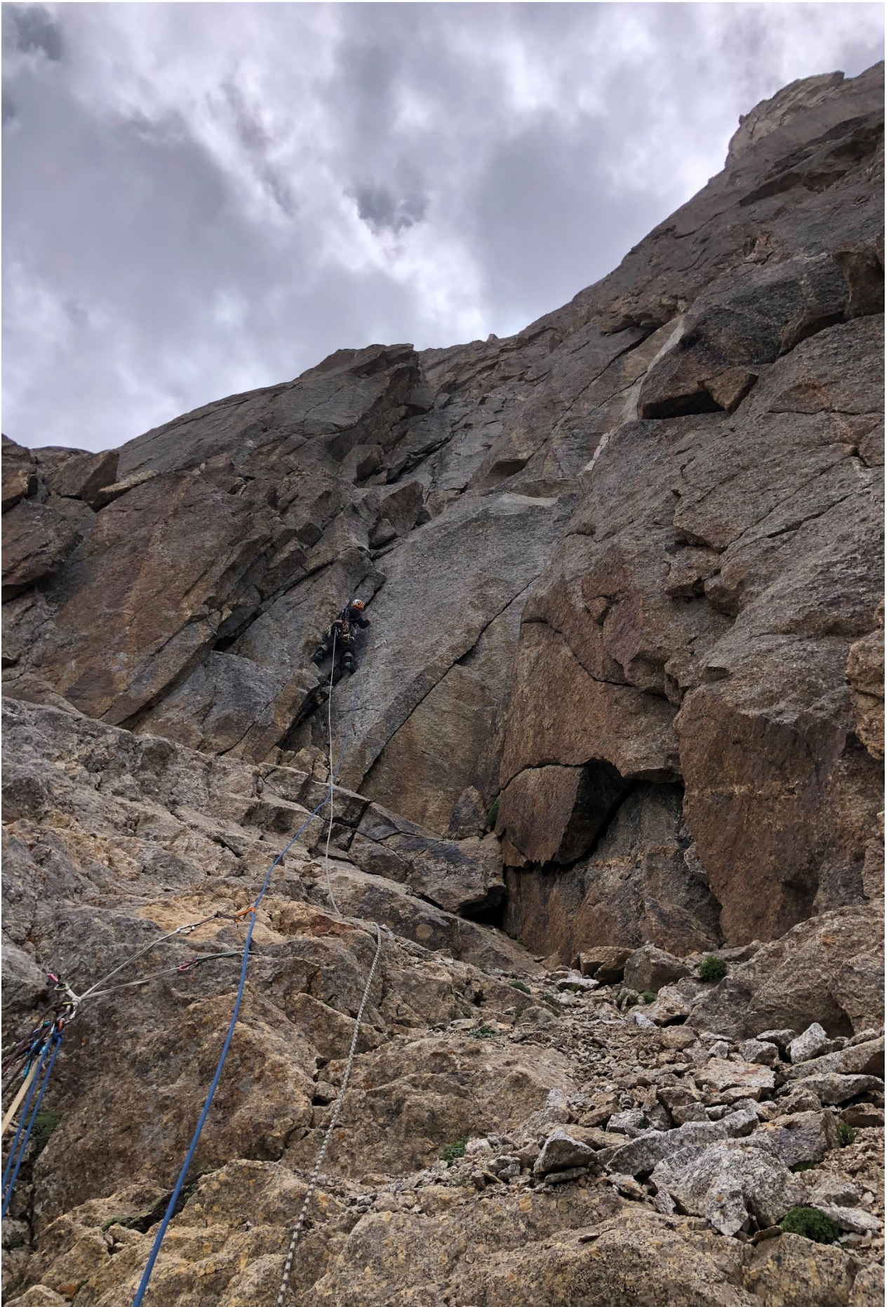
Фото 12. Участок R9 – R10