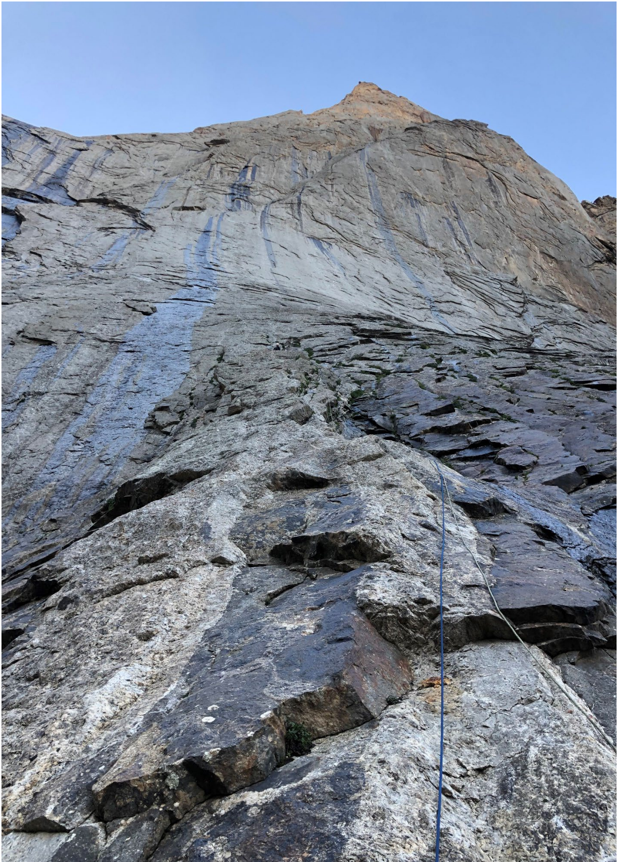
Фото 5. Участок R0 - R1