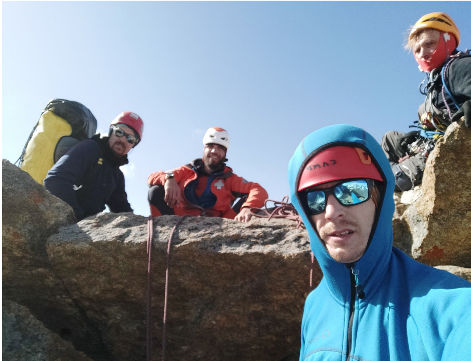
Фото 16. Команда на вершине у контрольного тура.