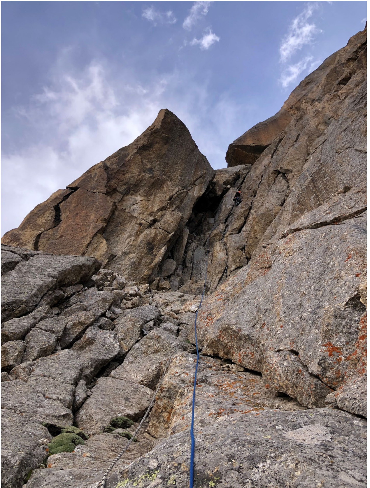
Фото 13. Участок R13 – R14