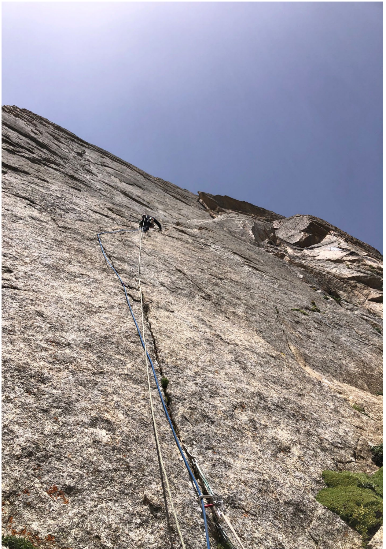
Фото 10. Участок R6 – R7