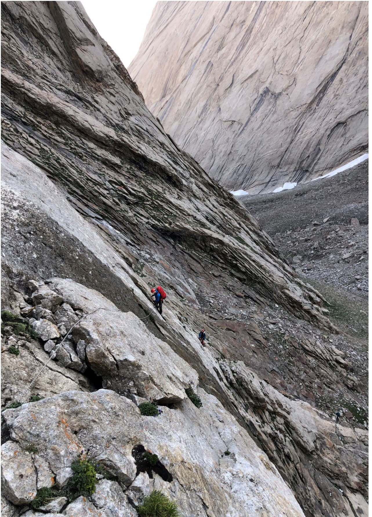
Фото 6. Участок R1 – R2