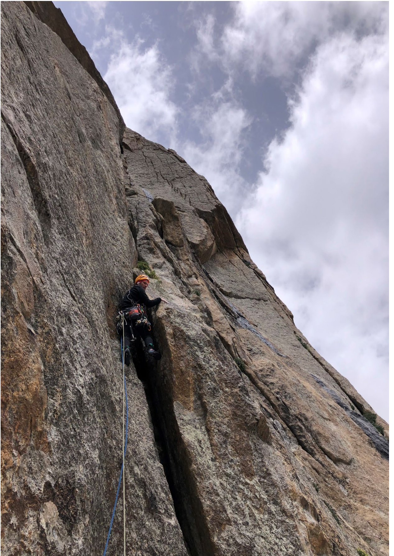
Фото 11. Участок R7 – R8