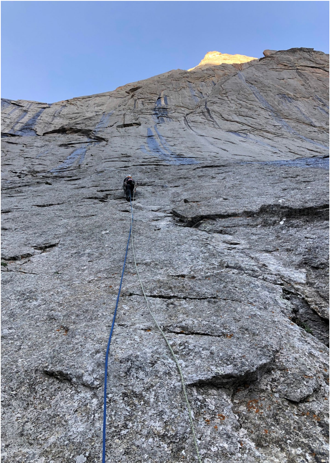
Фото 7. Участок R2 – R3