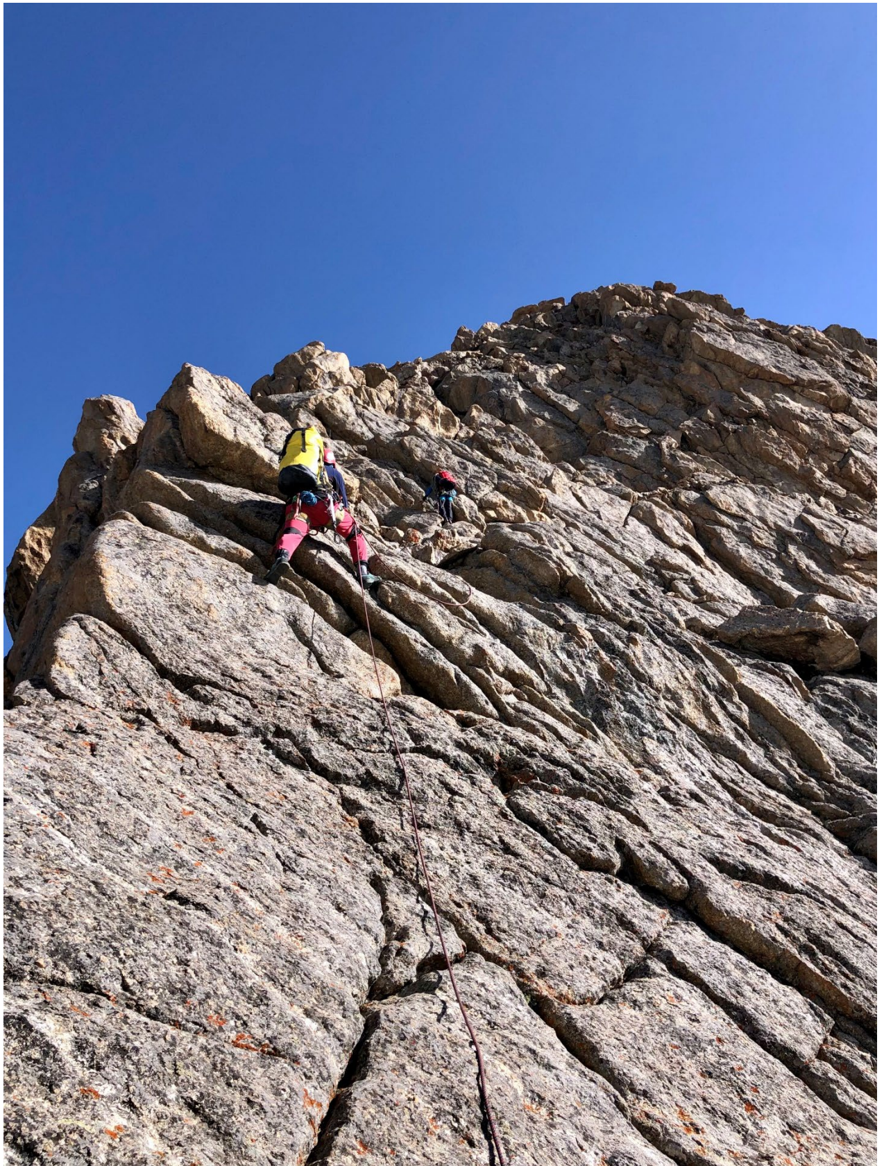
Фото 15. Участок R17 – R18