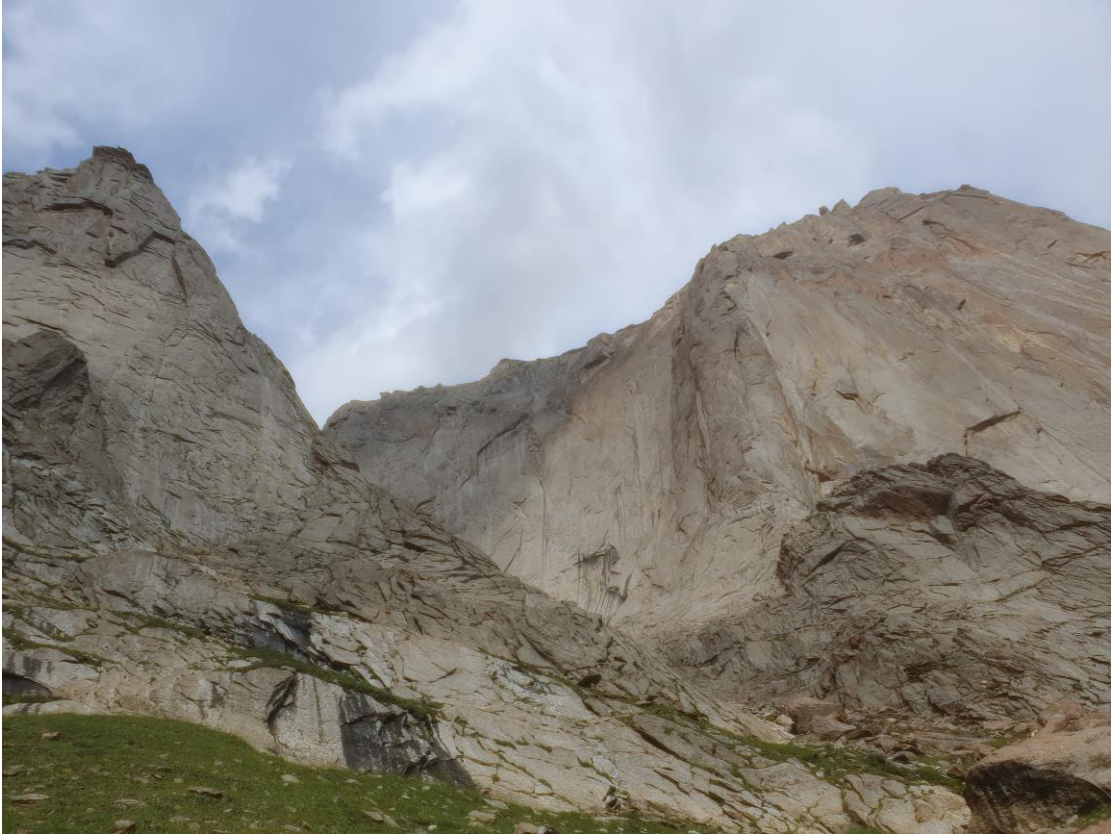
Подход под маршрут.