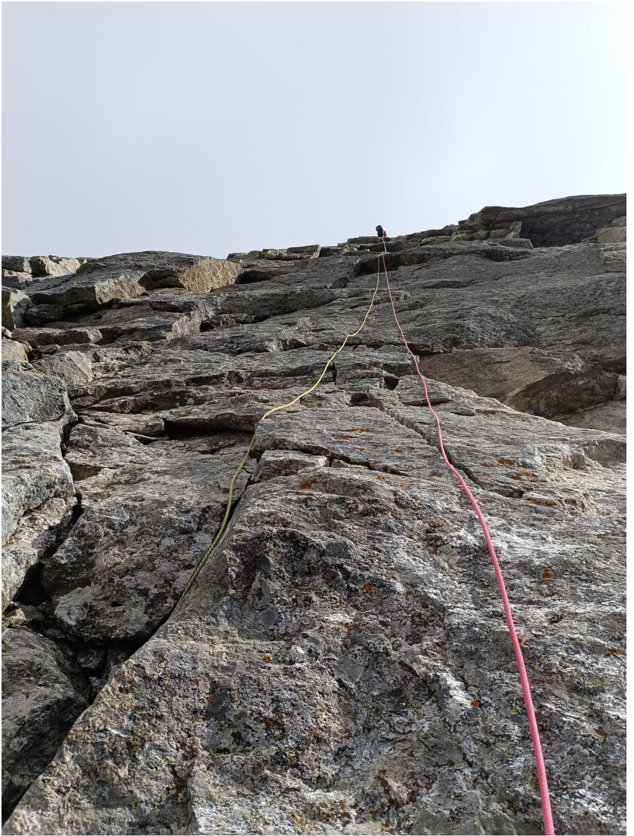
Работа на спуске.