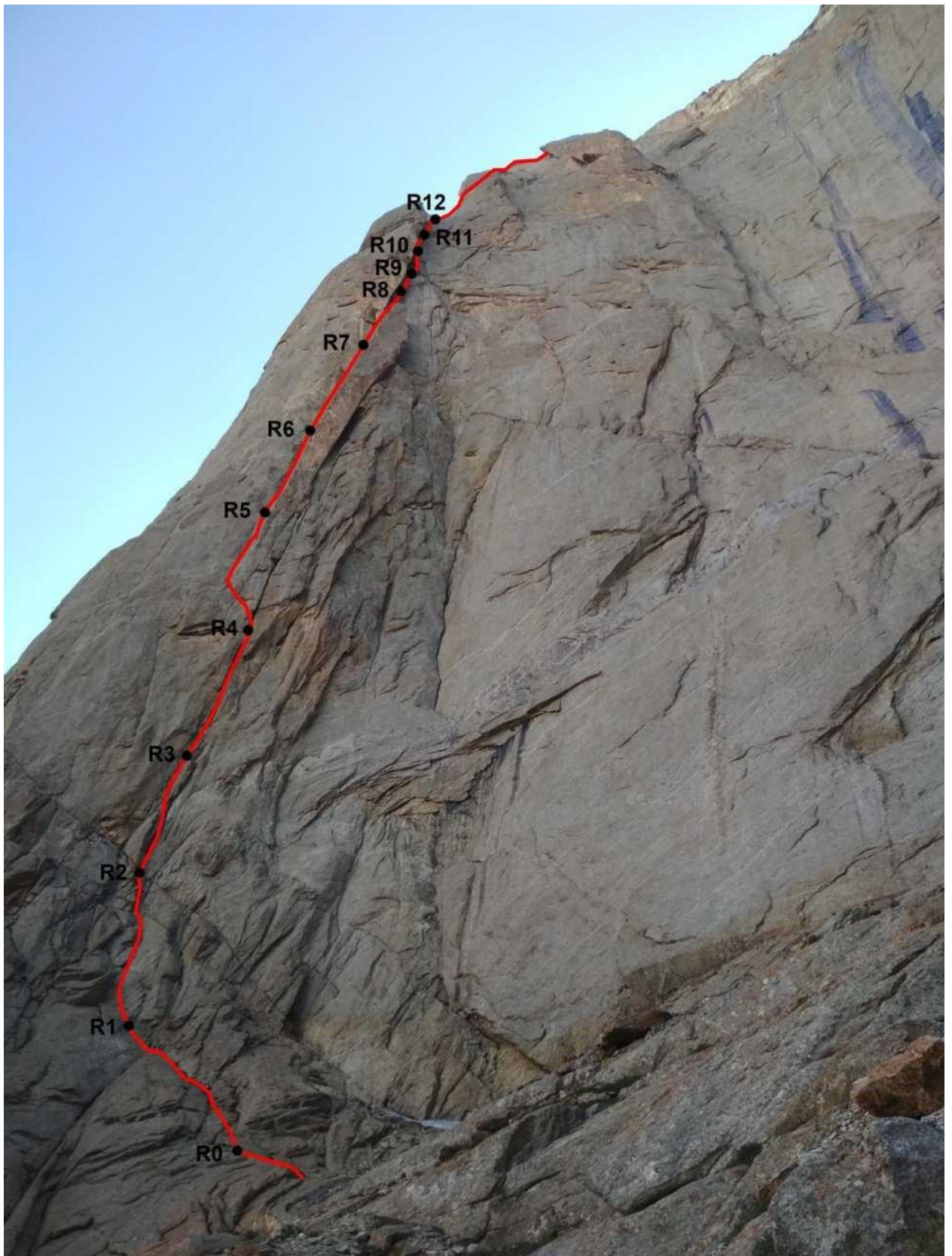
Техническое фото маршрута