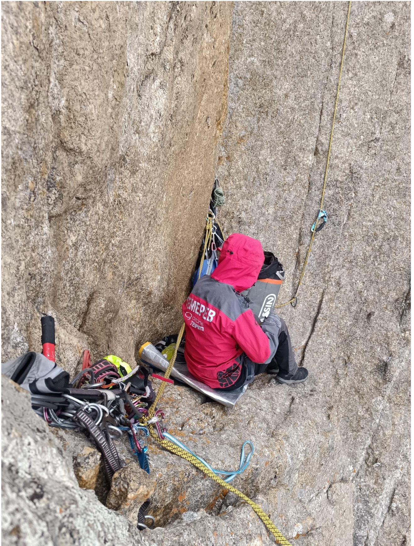
Ночёвка на R7.