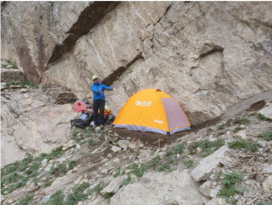
Площадка для ночевки в основании ЮЗ стены, 8 июля 2024