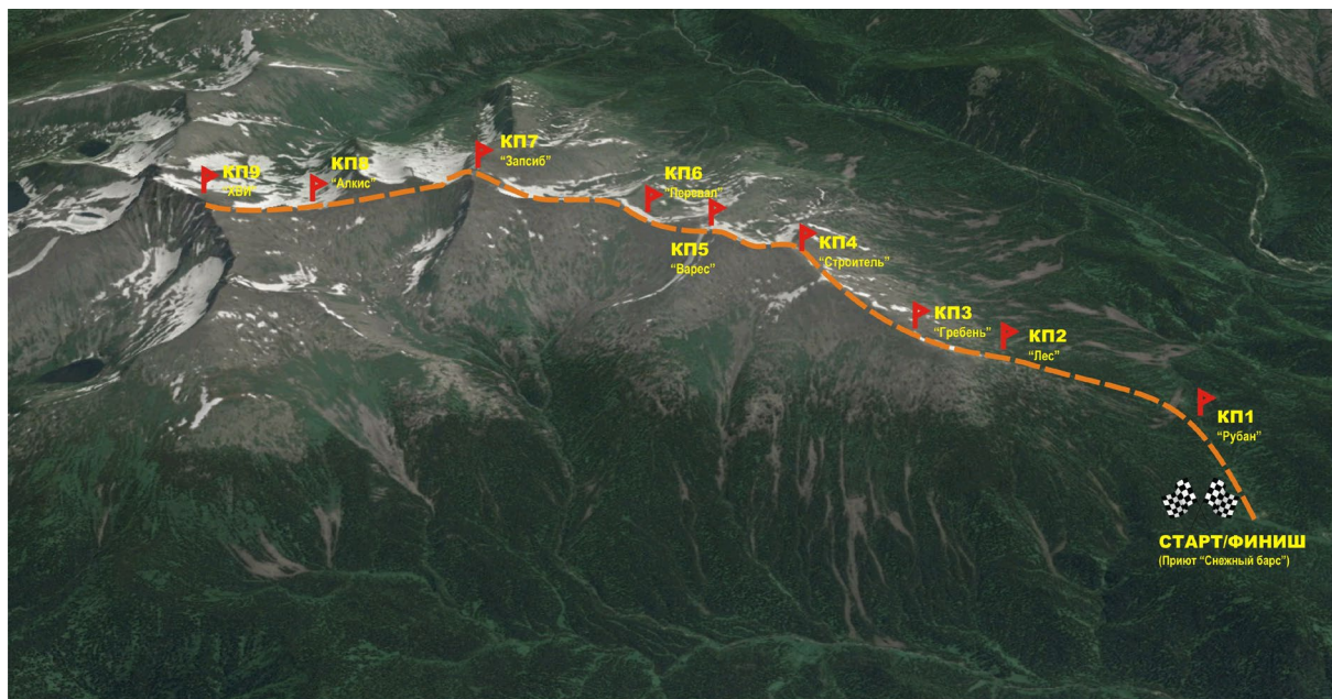
Схема трассы дисциплины «вертикальный километр»