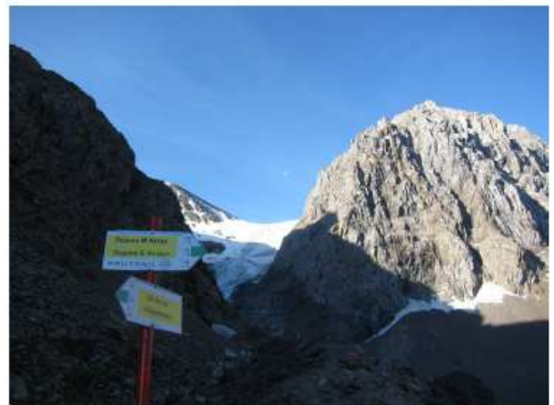
Ледник М Актру (справа в. Караташ)