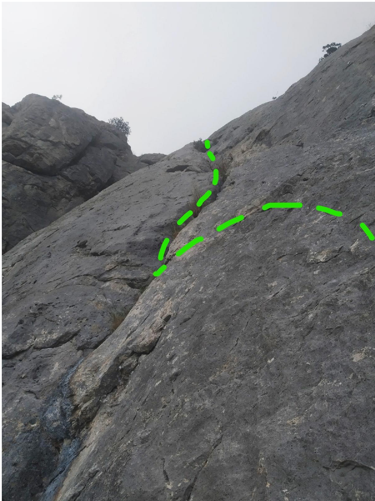
Рис. 3 Участок R6-R7, щель