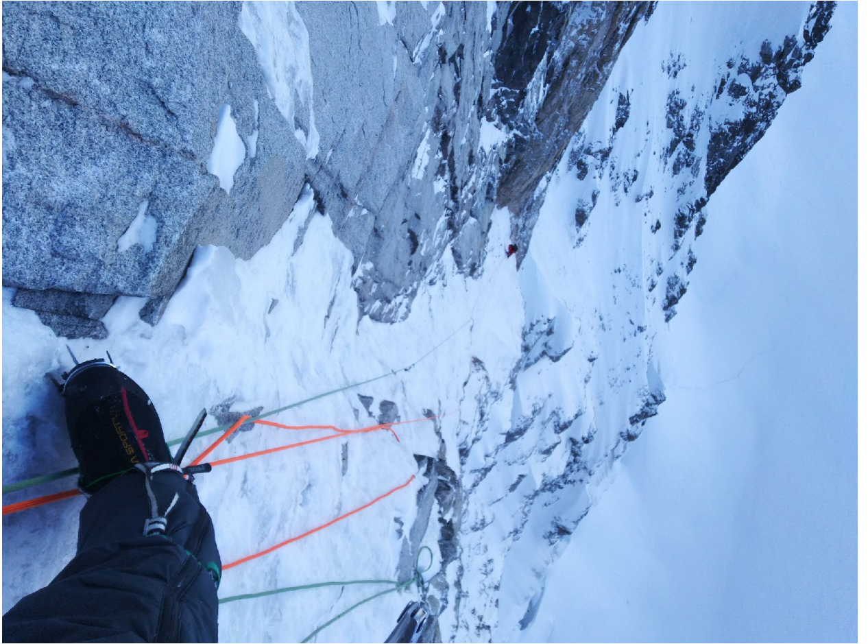
Фото 4. Участок R8 со станции R8