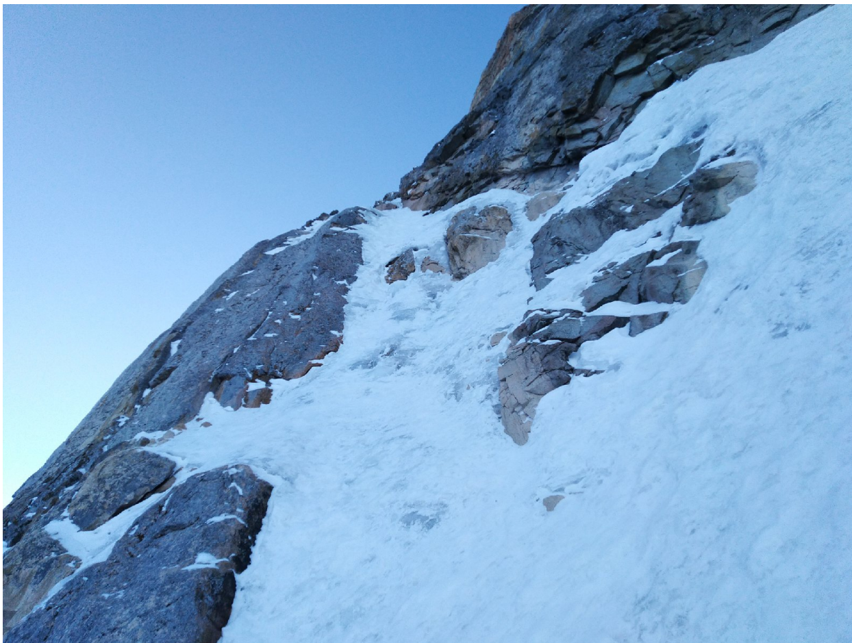
Фото 2. Участок R7 со станции R6