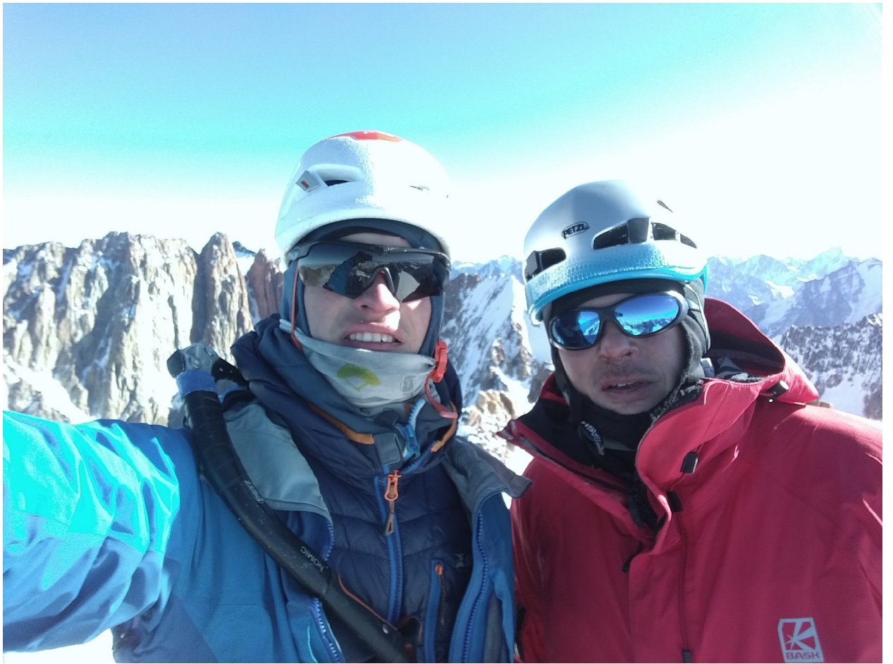
Фото 10. Команда на вершине