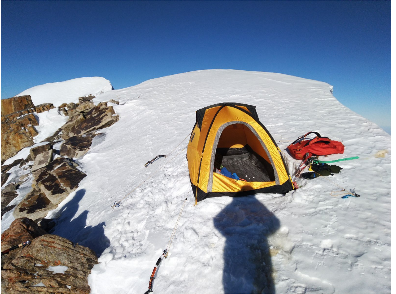
Фото 9. Бивуак под вершиной