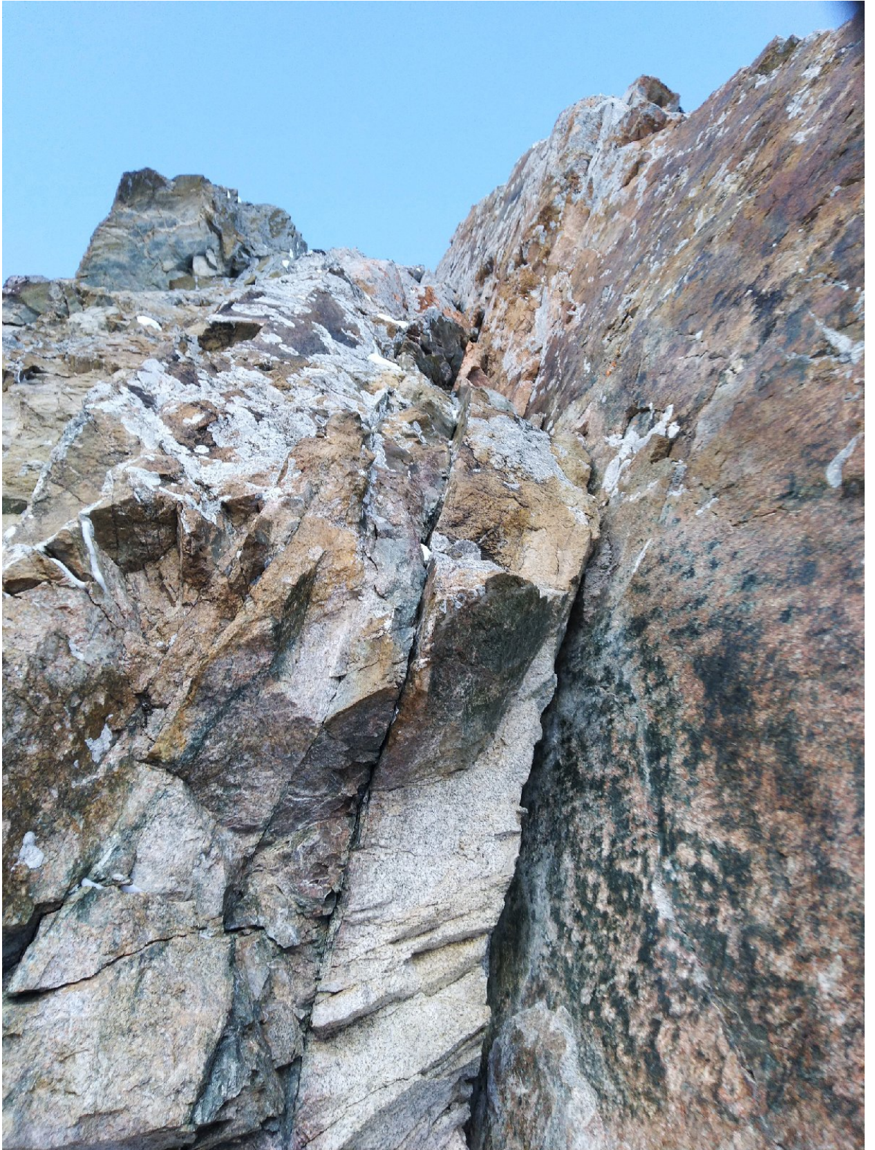
Фото 8. Участок R11