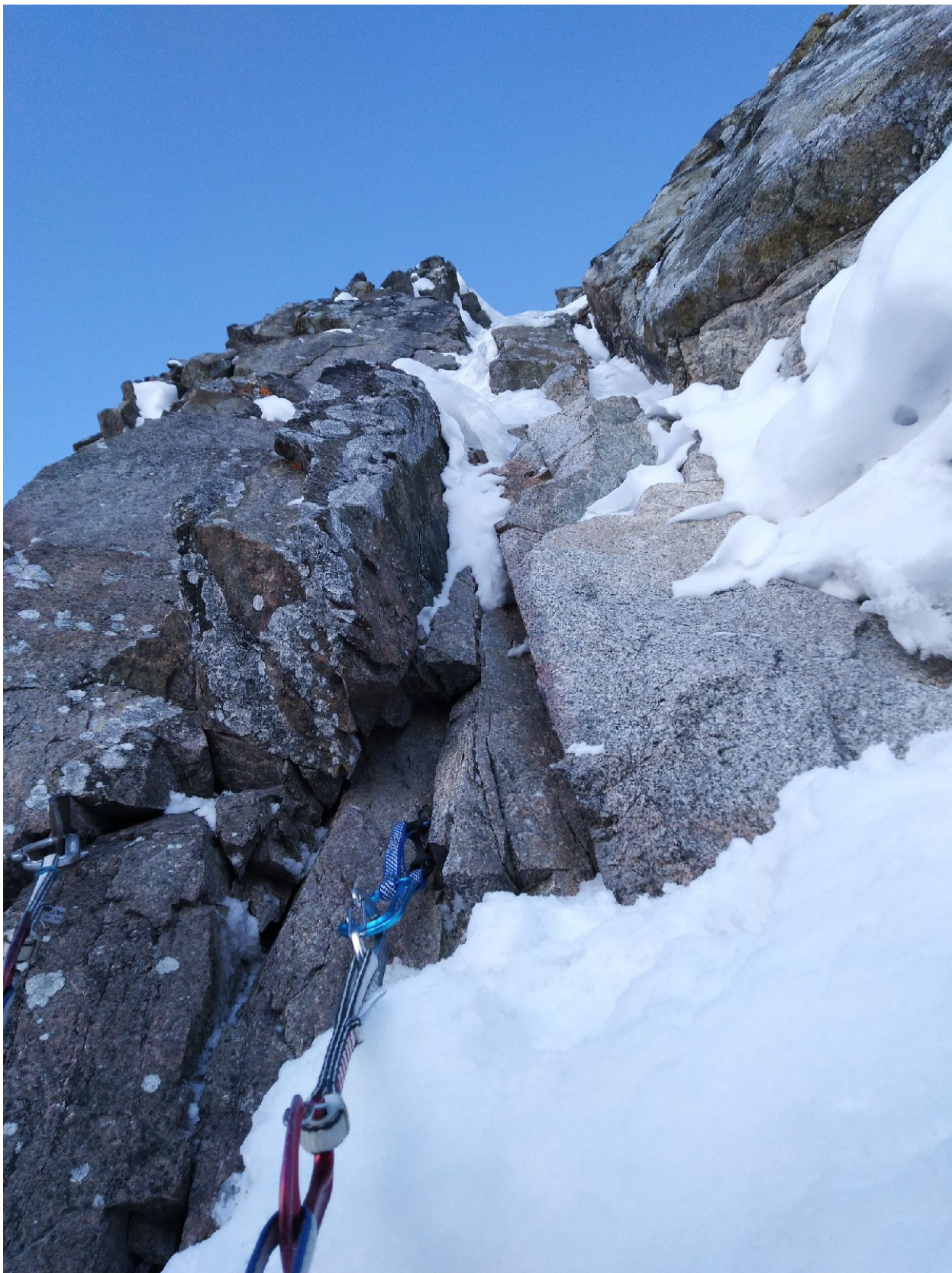
Фото 6. Участок R10, со станции R9