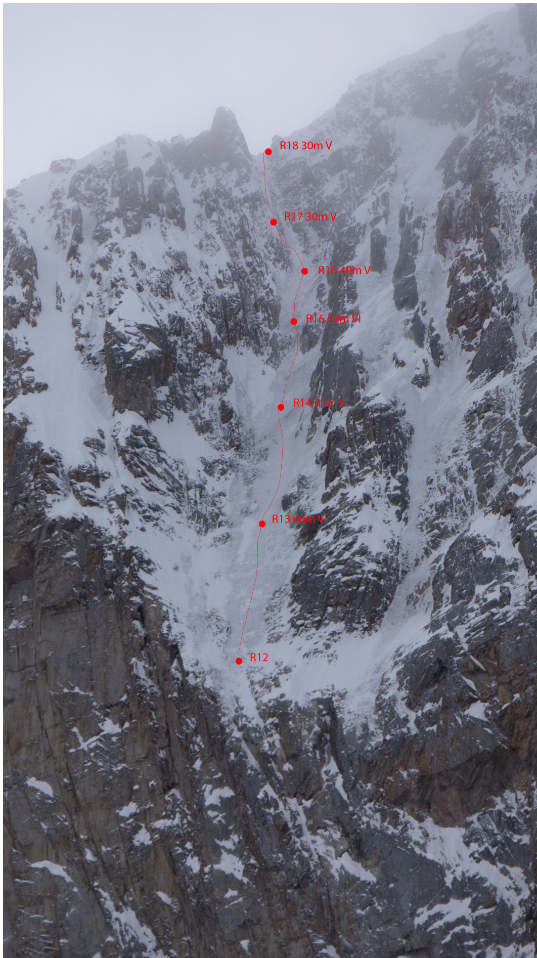
Подробное фото «Крыши»