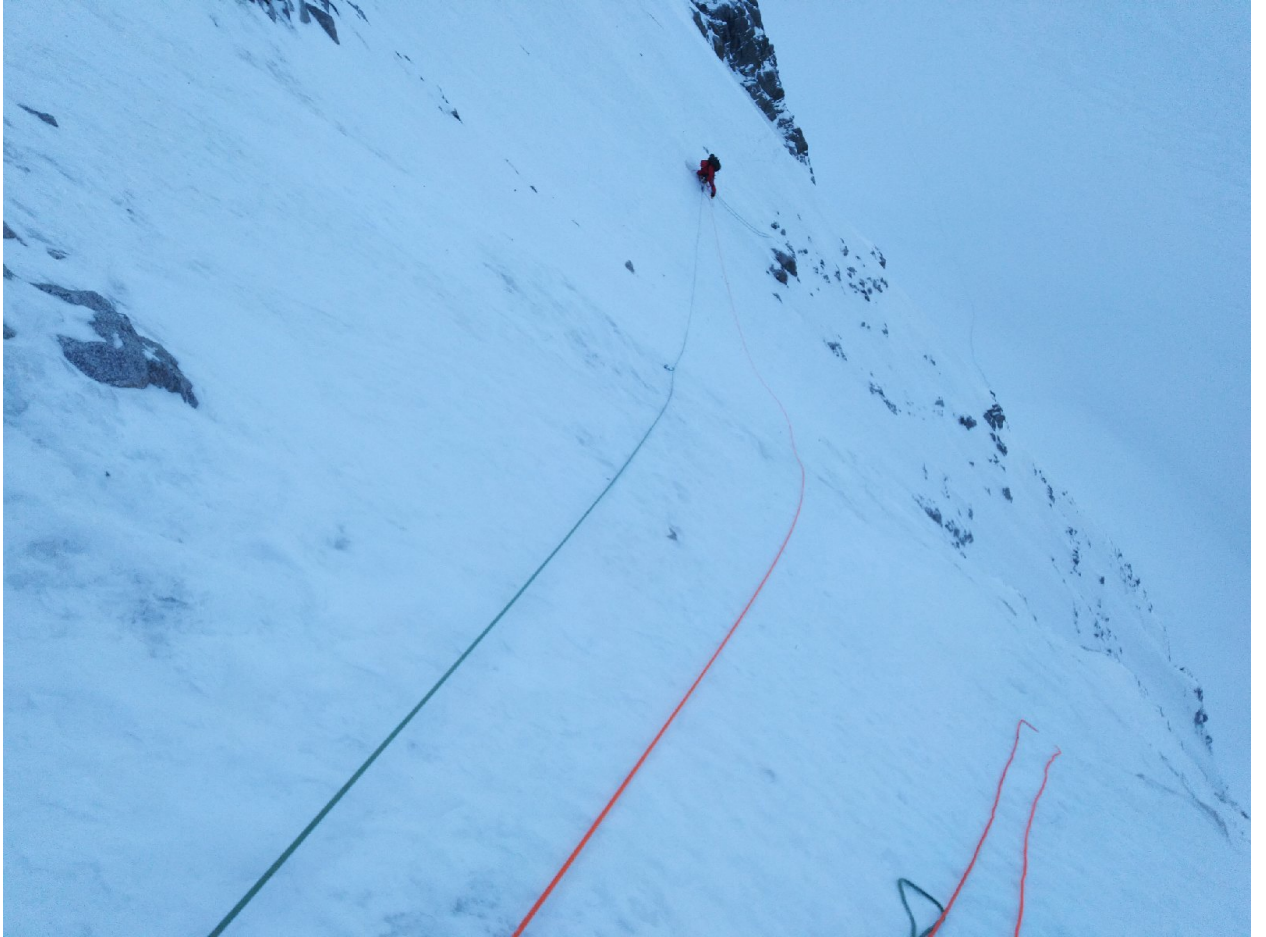
Фото 1. Участок R5 со станции R5