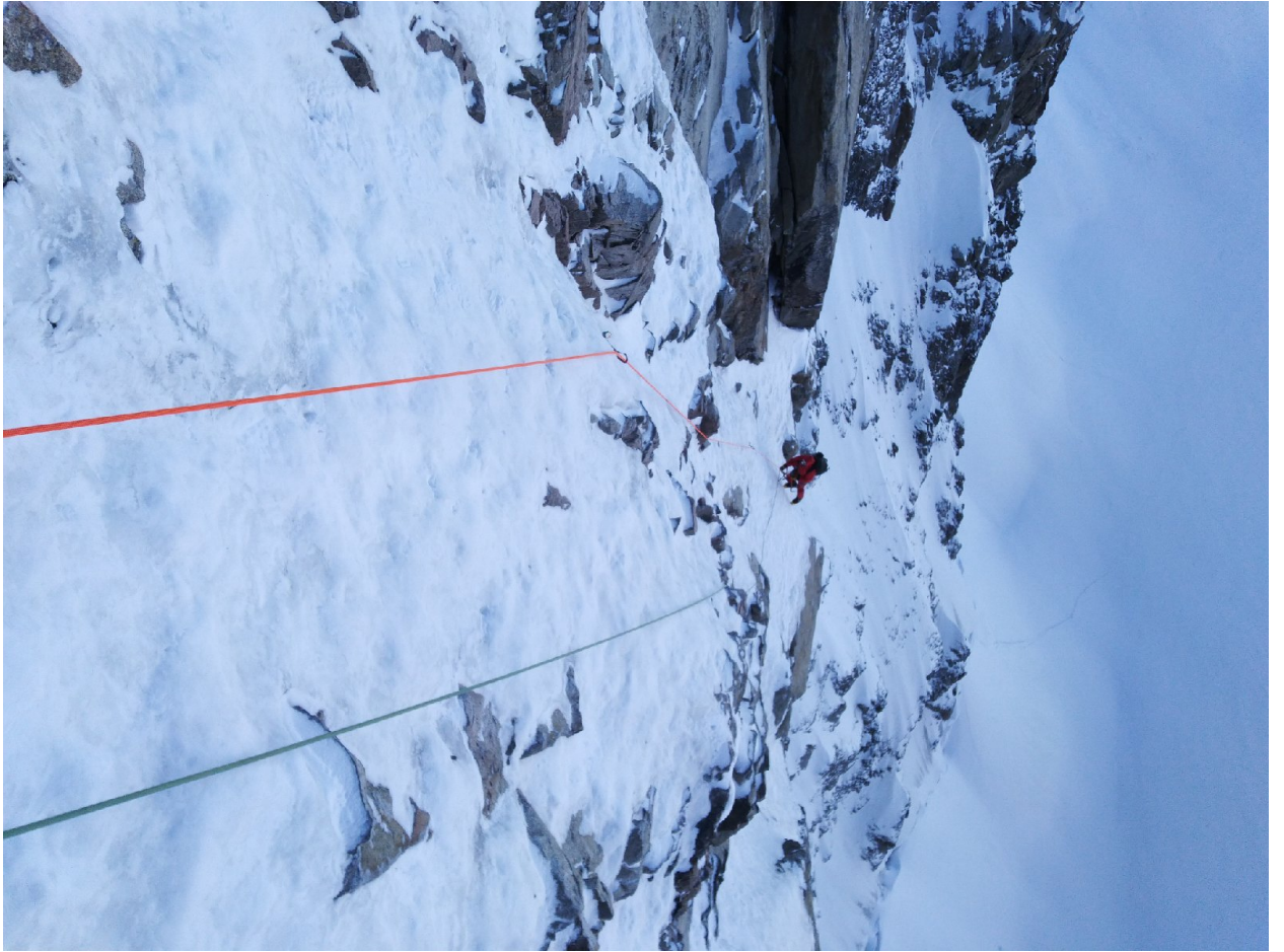
Фото 7.Участок R10, со станции R10