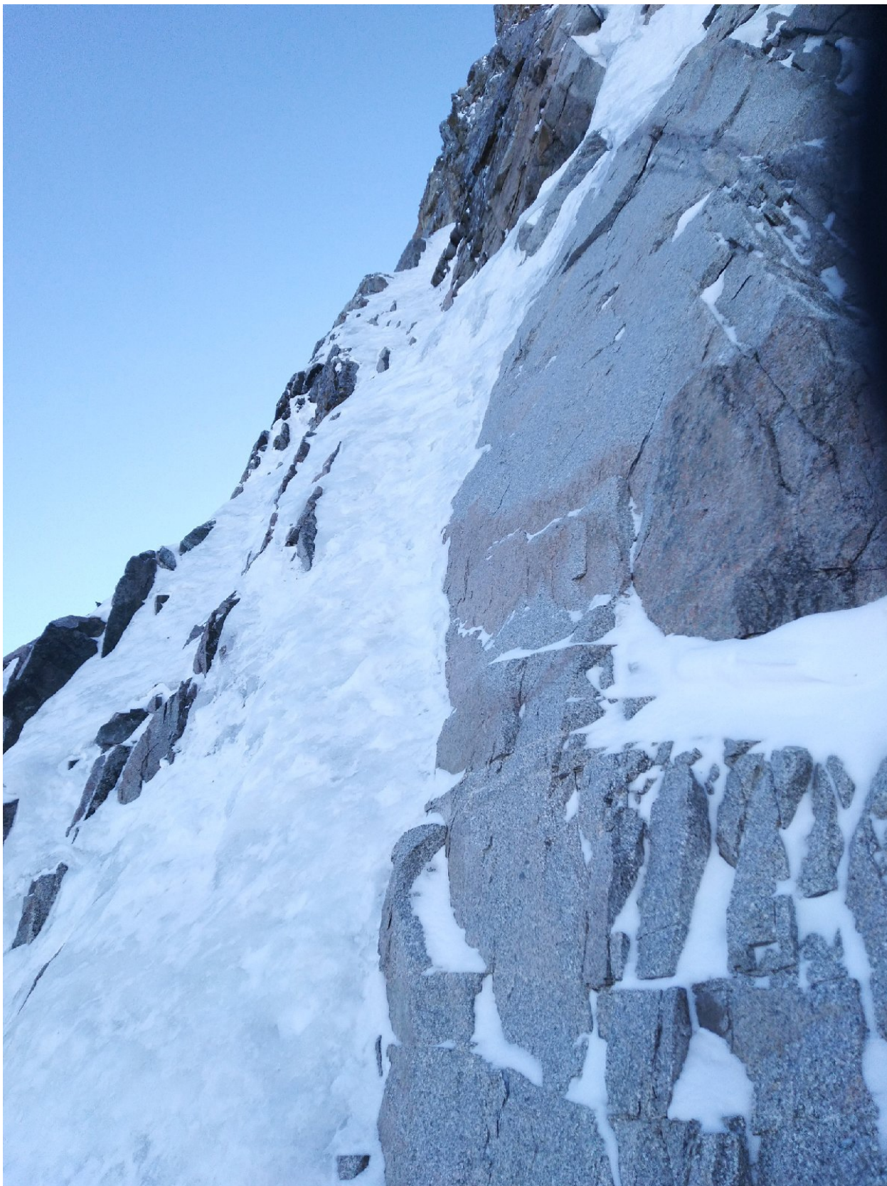
Фото 3. Участок R8 со станции R7