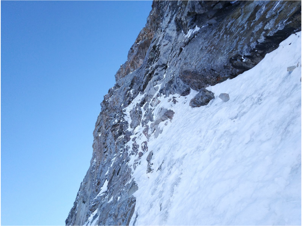
Фото 5. Участок R9, середина